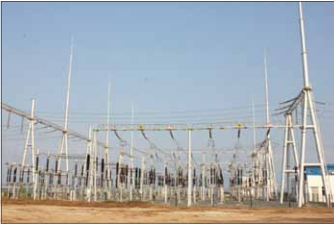
បណ្តាញបញ្ជូនអគ្គិសនីនៅខេត្តព្រះសីហនុ