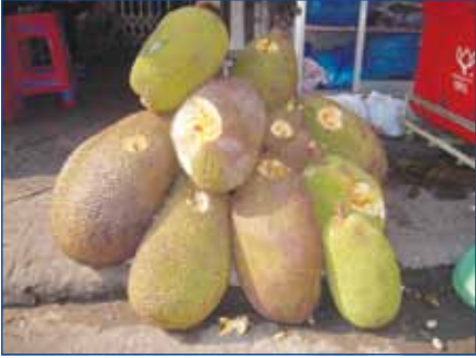
ផ្លែខ្មុរជាទីចូលចិត្តពិសាជនគ្រប់រូប

ផ្លែខ្មុរសម្បូរទៅដោយជាតិប៊ូតាស្យូមរហូតដល់ ៣០៣ មីលីក្រាមក្នុងចំនួនផ្លែខ្មុរ ១០០ ក្រាម ។ ការសិក្សាបានឱ្យដឹងថា អាហារដែលសម្បូរទៅដោយជាតិប៊ូតាស្យូមអាចជួយបញ្ចុះសម្ពាធឈាមបាន ។ ដូច្នេះហើយ ផ្លែខ្មុរមានប្រយោជន៍ក្នុងការបំបាត់បញ្ហាលើអ្នកដែលមានជំងឺលើសសម្ពាធជាជា