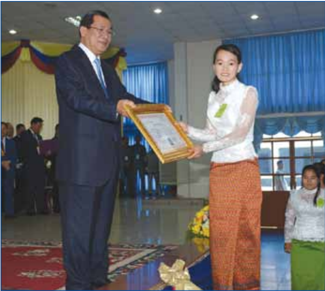
សម្តេចតេជោ ហ៊ុន សែន អញ្ជើញប្រគល់សញ្ញាបត្រ ជ័យលាភីដល់គុនស៊ីតនៃវិទ្យាស្ថានជាតិអប់រំ

តែមានតម្រូវការចាំបាច់ ដើម្បីបម្រើឱ្យទីផ្សារការងារនៅពេលដែលវិនិយោគ បានមកដល់ដែលយើងត្រូវមានធនធានមនុស្សដើម្បីបម្រើការងារឱ្យគេ ។ បម្រើឱ្យខ្សែសង្វាក់ផលិតកម្ម ។ បើមិនដូច្នោះទេយើងនៅតែរត់មិនទាន់ដំណើរ ក្នុងស្រុករបស់យើង ក៏ដូចជាសមាហរណកម្មនៅក្នុងក្របខណ្ឌតំបន់ផងដែរ ។ សម្តេចបញ្ជាក់ថា “ខ្ញុំក៏នៅតែបន្តអំពាវនាវដល់គ្រឹះស្ថានឧត្តមសិក្សាទាំងអស់ ទាំងរដ្ឋ ទាំងឯកជន ត្រូវយកចិត្តទុកដាក់ទៅលើបញ្ហាគុណភាពនៃការបណ្តុះ បណ្តាល ដោយត្រូវធានាធ្វើយ៉ាងណាការបណ្តុះបណ្តាលទាំងអារហូបករណ៍ ទាំងការសិក្សាបង់ថ្លៃនៅពេលបញ្ចប់ការសិក្សាត្រូវតែមានគុណភាព ដើម្បី បម្រើឱ្យទីផ្សារការងារ ។ ទាំងការងាររដ្ឋ ទាំងការងារឯកជនដែលជាតម្រូវ ការចាំបាច់ ហើយដែលក្រសួងអប់រំ យុវជន និងកីឡា ត្រូវបន្តការខិតខំធ្វើនូវ កិច្ចការទាំងអស់នេះ” ។