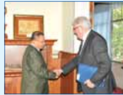
ឯកឧត្តម សាយ ឈុំ ជួបសវនាការ ជាមួយគណៈប្រតិភូសភាសហភាពអឺរ៉ុប

ក្នុងឱកាសអញ្ជើញសម្តេចដាក់ឱ្យប្រើ ប្រាស់ផ្លូវជាតិលេខ ៥៧ បេ ដែលតភ្ជាប់ ពីស្រុកបរិល ខេត្តបាត់ដំបង ទៅតំបន់ ព្រំដែន កម្ពុជា-ថៃ (ថ្ងៃទី ១០ ខែមីនា ឆ្នាំ ២០១៤ )