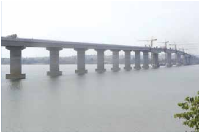
ការដ្ឋានស្ថាបនាស្ពានមេគង្គ ខេត្តស្ទឹងត្រែងប្រវែង ១.៧៣១ ម៉ែត្រ

គម្រោងសាងសង់ស្ពានអ្នកលឿងប្រវែង ២,២២ គ.ម សម្រេចបាន ៧៣,៥០% ។ គម្រោងបង្ការគ្រោះមហន្តរាយដោយទឹកជំនន់ចាប់ផ្តើម