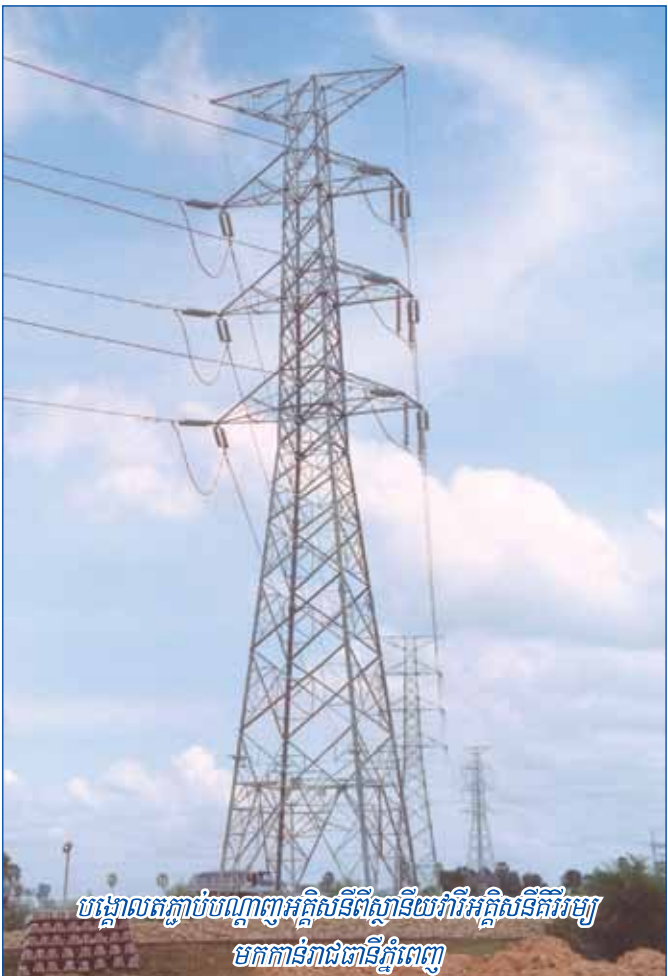
បង្គោលតភ្ជាប់បណ្តាញអគ្គិសនីពីស្ថានីយវារីអគ្គិសនីភ្នំពេញ មកកាន់រាជធានីភ្នំពេញ

ម៉ាស៊ីនដំណើរការផលិតភ្លើងចំនួនបួនដែលអាចផលិតអគ្គិសនីនៅរដូវប្រាំងបាន ព្រោះថាទំនប់ខាងក្រោមអាចស្តុកទឹកបាន ១៨០០ ម៉ែត្រគូប និងទំនប់ខាងលើបាន ៤០១៨ លានម៉ែត្រគូប ។ វារីអគ្គិសនីស្ទឹងឫស្សីជ្រៃ គឺជាគម្រោងទីបួន ក្នុងចំណោមគម្រោងវារីអគ្គិសនីចំនួន ៦