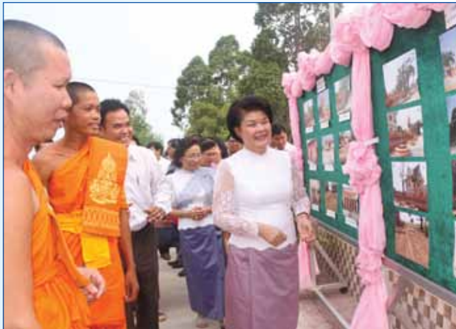
សាមគ្គី និងបានប្រគេនបច្ច័យព្រះត្រូវចៅអធិការវត្តចំនួន១០ម៉ឺនរៀល សាជក១និងព្រះសង្ឃ១១អង្គក្នុង១អង្គ ១១សាជក១បច្ច័យ៥ម៉ឺនរៀល ។

ថ្ងៃទី ២៣ ខែមីនា ឆ្នាំ ២០១៤ លោក ជំទាវ ឃុន សុដារី សមាជិកគណៈអចិន្ត្រៃយ៍គណៈកម្មាធិការកណ្តាលគណបក្សប្រជាជនកម្ពុជាអនុប្រធានទី២នៃរដ្ឋសភា អញ្ជើញជាអធិបតីក្នុងពិធីសម្ពោធដាក់អោយប្រើប្រាស់សមិទ្ធផលនានាក្នុង វត្តមណីរតនារាម ហៅវត្តពាមរាំងក្រោម ស្ថិតក្នុងឃុំពាមរាំង ស្រុកលើកដែក ខេត្តកណ្តាល។ ក្នុងពិធីនោះលោកជំទាវ ឃុន សុដារី បានប្រគេនបច្ច័យកសាងវត្តចំនួន១៣ លាន ៤សែនរៀលដល់ព្រះចៅអធិការវត្តមណីរតនារាមប្រគេនបច្ច័យព្រះសង្ឃ១១អង្គ លោកគ្រូអ្នកគ្រូ៦២នាក់ យុវជនកាកបាទក្រហមកម្ពុជា និងសិស្សកាយវិទ្យា១០០នាក់ សិស្សានុសិស្សចំនួន១០០នាក់ សាលាឃុំពាមរាំង ក្រុមការងារវេទិកាក្នុងឃុំពាមរាំង ខ្សែបូ ៥នាក់កងកម្លាំងការពារ ២០នាក់ និងតាជីយាយជី៥០នាក់និងបានវេទយ្យ ទាន ប្រគេនព្រះសង្ឃ មានអង្គ ១៥០គឺឡូក្រាម ទឹកក្រូច៤កេស ទឹកសុទ្ធច១កេស និង ម្សៅសាប៊ូមួយចំនួនដល់ព្រះសង្ឃផងដែរ។ បន្ទាប់មកនៅព្រឹកថ្ងៃដដែលលោកជំទាវ ឃុន សុដារី បានអញ្ជើញចូលរួមក្នុងពិធីបុណ្យផ្កាសាមគ្គីនៅវត្តព្រែកទម្លាប់ ឃុំព្រែក ទម្លាប់ ស្រុកលើកដែក ខេត្តកណ្តាល ដោយបាននាំយកអង្ករ១០០គីឡូក្រាម ទឹកក្រូច ៤កេស ទឹកសុទ្ធច១កេសនិងបច្ច័យ១លាន៤សែនរៀលចូលរួមក្នុងពិធីបុណ្យផ្កា