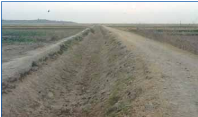
ប្រឡាយមេនាំទឹកស្រោចស្រែព្រៃស្រែប្រជាកសិករស្រុកជលគិរី