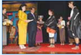
សម្តេចតេជោ : ការនិយាយរបស់ នាយករដ្ឋមន្ត្រីក្នុងតំណែង វ៉ាន់ណាណា ធីនី វ៉ាន់ណាណា : ទន្ទ្រាំជើងមួយកន្លែងជាសត្រូវ របស់វ័ប្បធម៌