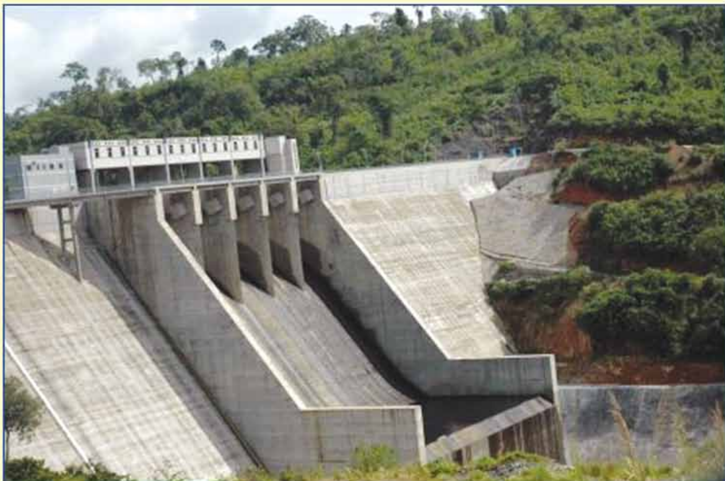
ស្ថានីយវារីអគ្គិសនីស្ទឹងអាត់ មានអានុភាព ១២០ មេហ្គាវ៉ាត់ និងអនុស្ថានីយអូសោម ស្ថិតក្នុងឃុំអូសោម ស្រុកចាស់វែង ខេត្តពោធិ៍សាត់ (សម្ពោធច្រើន ២៧ ខែមីនា ឆ្នាំ ២០១៤)