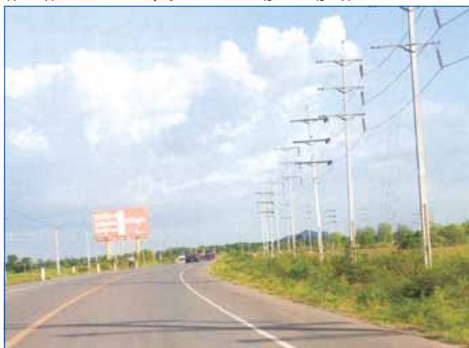
បង្គោលបណ្តាញតភ្ជាប់ចរន្តអគ្គិសនីពីប្រទេសថៃតាមផ្លូវជាតិលេខ ៦ ពីខេត្តបន្ទាយមានជ័យ មកកាន់ខេត្តសៀមរាប

ឯកឧត្តម ស៊ុយ សែម រដ្ឋមន្ត្រីក្រសួងរ៉ែ និងថាមពល បានមានប្រសាសន៍នៅក្នុងឱកាសសន្និបាតប្រចាំឆ្នាំរបស់អាជ្ញាធរអគ្គិសនីកម្ពុជាថា ពេលនេះជាឱកាសមួយផ្តល់ឱ្យអ្នកពាក់ព័ន្ធក្នុងវិស័យអគ្គិសនីអាចធ្វើការពិភាក្សាជាមួយគ្នាដើម្បីពិនិត្យមើលឡើងវិញ អំពីការផ្គត់ផ្គង់អគ្គិសនីក្នុងឆ្នាំ ២០១៣កន្លងទៅ និងរកវិធីកែលម្អឱ្យកាន់តែប្រសើរកាន់តែមានប្រសិទ្ធភាព និងកាន់តែមានសុវត្ថិភាពឡើង ព្រមទាំងរកវិធីជំរុញការអភិវឌ្ឍវិស័យអគ្គិសនីរបស់រាជរដ្ឋាភិបាល ដែលមានសម្តេចអគ្គមហាសេនាបតីតេជោ ហ៊ុន សែន ជានាយករដ្ឋមន្ត្រី ឱ្យកាន់តែមានការរីកចម្រើនថែមទៀត ។ ក្នុងឱកាសនោះឯកឧត្តមរដ្ឋមន្ត្រីក្រសួងរ៉ែ និងថាមពលបានបញ្ជាក់ថា សម្រាប់រយៈពេល ៥ ឆ្នាំ ២០១៣ ដល់ ២០១៨ ក្រសួងបានកំណត់ទិសដៅយុទ្ធសាស្ត្រសំខាន់ៗ ចំនួន ៥ ដែលរួមមាន ១-ត្រូវរក្សាឱ្យបានតុល្យភាពនៃការផ្គត់ផ្គង់ និងតម្រូវការថាមពលអគ្គិសនី ២-ពង្រីកទំហំ និងវិសាលភាពនៃសេវាផ្គត់ផ្គង់អគ្គិសនី ៣-លើកកម្ពស់សមធម៌ក្នុងការទទួលសេវាផ្គត់ផ្គង់អគ្គិសនីនៅតំបន់ជនបទ ៤-ពង្រីកស្ថិរភាព និងគុណភាពនៃសេវាផ្គត់ផ្គង់អគ្គិសនី និង ៥-ជំរុញកាត់បន្ថយគម្លាតតម្លៃអគ្គិសនី ។/