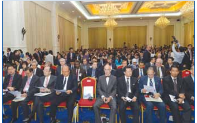
សម្តេចអគ្គមហាសេនាបតីតេជោ ហ៊ុន សែន អញ្ជើញជាអធិបតីភាពក្នុងវេទិកាអាជ្ញាភិបាល និងវិស័យឯកជនលើក ទី ១៧ នៅវិមានសន្តិភាព

នៅថ្ងៃទី ៤ ខែមីនា ឆ្នាំ ២០១៤ វេទិកាអាជ្ញាភិបាល ផ្នែកឯកជនលើក ទី ១៧ ដែលហៅថាជាកិច្ចប្រជុំពេញអង្គបើកទូលាយរបស់គណៈរដ្ឋមន្ត្រី បានប្រព្រឹត្តទៅនៅវិមានសន្តិភាព ក្រោមអធិបតីភាពសម្តេចអគ្គមហាសេនាបតី តេជោ ហ៊ុន សែន នាយករដ្ឋមន្ត្រីនៃព្រះរាជាណាចក្រកម្ពុជា ។ ក្រុមការងារវិស័យឯកជនចំនួន ១០ បាន ចូលរួមលើកជាដំណូម ពរឱ្យមានការដោះស្រាយនៅក្នុងវេទិកានេះ ដែលរួមមានជាអាទិ៍ គឺ ១-ក្រុមការងារវិស័យឯកជនផ្នែកទេសចរណ៍ ២-ក្រុមការងារវិស័យឯកជនផ្នែកដឹកជញ្ជូន ៣-ក្រុមការងារ វិស័យឯកជនផ្នែកថាមពល និងធនធានរ៉ែ ៤-ក្រុមការងារវិស័យឯកជនផ្នែកស្រូវ អង្ករ ៥-ក្រុមការងារវិស័យឯកជនផ្នែកផលិតកម្មកែច្នៃសម្រាប់ការនាំចេញ និងកិច្ចសម្រួលពាណិជ្ជកម្ម ៦-ក្រុមការងារវិស័យឯកជនផ្នែកធនាគារ និងហិរញ្ញវត្ថុ ៧-ក្រុមការងារវិស័យឯកជនផ្នែកនីតិកម្មពន្ធដារនិងអភិបាលកិច្ច ៨-ក្រុមការងារវិស័យឯកជនផ្នែកកម្មនុសាសន៍ និងសហគ្រាសធុនតូច និងមធ្យម និងសេវាកម្ម ៩-ក្រុមការងារវិស័យឯកជនផ្នែកកសិកម្ម និងកសិ-ឧស្សាហកម្ម និង ១០-ក្រុមការងារវិស័យឯកជនផ្នែកទំនាក់ទំនងវិជ្ជាជីវៈ ។