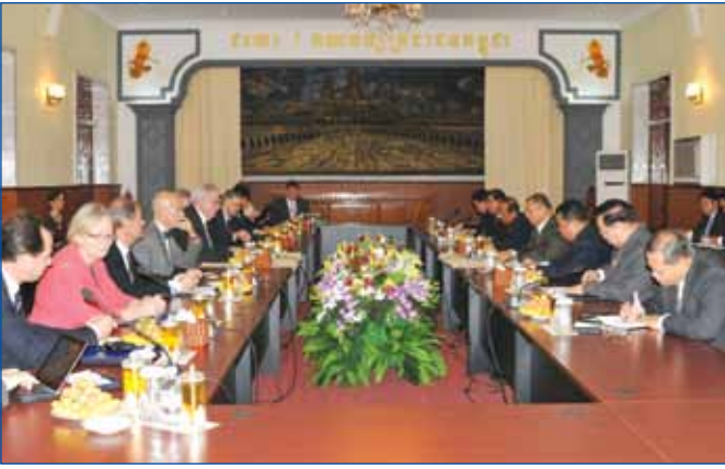
ទិដ្ឋភាពរូបនៃកិច្ចសវនការជាមួយគណៈប្រតិភូសភាសហភាពអឺរ៉ុប

កម្ពុជានឹងបន្តពង្រឹងសមាជិកគណបក្សទាំងខាងនយោបាយ សតិអារម្មណ៍ និង ចាត់តាំង ។