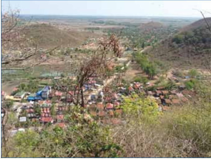
ទិដ្ឋភាពទិរ្វមស្រុកជលគិរី ខេត្តកំពង់ឆ្នាំង

ការអភិវឌ្ឍន៍ទាមទារការបោះជំហានទៅមុខដោយ សន្សឹមៗ ។ មួយជំហានម្តងៗនិងឆ្ពោះទៅដល់គោលដៅចុងក្រោយយ៉ាងពិតប្រាកដ ។ និយាយពីការអភិវឌ្ឍន៍គឺមិនមែនប្រដូចបានទៅនឹងការយល់សប្តិបានទេ ប៉ុន្តែគឺមានគោលការណ៍ មានផែនការជាដំណាក់កាលច្បាស់លាស់ណាស់ ។ ស្រុកជលគិរីកំពុងស្ថិតក្នុងស្ថានភាពនេះ ។ ដំណើរការអភិវឌ្ឍរបស់ស្រុកនេះចាប់ផ្តើមចេញពីបាតដៃទទេ ក្រោយឆ្នាំ ១៩៧៩ ប៉ុន្តែជាង ៣៥ ឆ្នាំ ក្រោយមក មានសមិទ្ធផលលេចធ្លោជាច្រើនដែលយើងបានឃើញច្បាស់ផ្ទាល់ភ្នែក ។ អភិវឌ្ឍន៍មិនមែនជាការយល់សប្តិ ប៉ុន្តែកាលពី ៣៥ ឆ្នាំមុន អ្នកស្រុកជលគិរីសូម្បីតែយល់សប្តិក៏មិនអាចនឹកឃើញថាខ្លួនកសាងបាននូវសមិទ្ធផលដ៏ច្រើនបែបនេះដែរ ។ មែនហើយ មហិទ្ធភាពនៃការអភិវឌ្ឍរបស់ប្រជាជននៅស្រុកជលគិរីមិនបានបញ្ចប់ត្រឹមនេះទេ ប៉ុន្តែត្រូវធ្វើដំណើរទៅមុខទៀត ក្រោមការដឹកនាំរបស់រាជរដ្ឋាភិបាលកម្ពុជាសម្រាប់នីតិកាលទី ៥ នៃរដ្ឋសភា ។