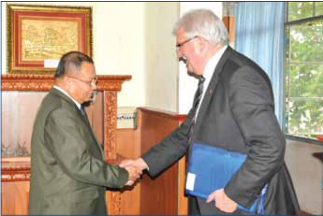
ឯកឧត្តម សាយ ឈុំ ទទួលជួបសវនាការជាមួយ

ឯកឧត្តម LANGEN WERNER ប្រធានគណៈប្រតិភូសភាសហភាពអឺរ៉ុប