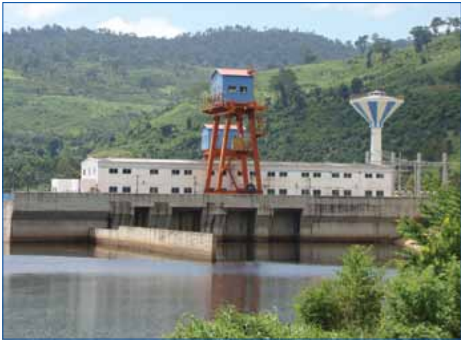
ស្ថានីយវារីអគ្គិសនីកំចាយ ក្នុងខេត្តកំពត

អគ្គិសនីគឺជាថាមពលមិនអាចខ្វះបានក្នុងការបម្រើឱ្យវិស័យសេដ្ឋកិច្ច វប្បធម៌ សង្គម និង ជីវភាពរស់នៅរបស់ប្រជាជន។ បច្ចុប្បន្ន អគ្គិសនីកម្ពុជាបានបង្ហាញឱ្យឃើញពីភាពរីកចម្រើនគួរកត់សម្គាល់ ទាំងប្រភពអគ្គិសនីបណ្តាញអគ្គិសនីជាតិ និងតម្លៃប្រើប្រាស់នៅតំបន់ដែលបានតភ្ជាប់ជាមួយនិងបណ្តាញជាតិ។ តាមរបាយការណ៍របស់អាជ្ញាធរអគ្គិសនីកម្ពុជាបានបង្ហាញឱ្យឃើញថា នៅក្នុងឆ្នាំ ២០១៣ កន្លងទៅនេះ ថាមពលអគ្គិសនីប្រើប្រាស់នៅទូទាំងប្រទេសកម្ពុជាបានកើនឡើង ២២% ពី ៣ ៩២៧ លានគីឡូវ៉ាត់ម៉ោង នៅឆ្នាំ ២០១២ ដល់ ៤ ២៩៧ លានគីឡូវ៉ាត់ម៉ោងនៅឆ្នាំ២០១៣ ។ អនុភាពប្រភពអគ្គិសនីដែលកម្ពុជាមាន បានកើនឡើងដល់ទៅ ៦៦.៧០% លើសពីឆ្នាំមុនគឺពី ៨២២ ម៉េហ្គាវ៉ាត់ នៅឆ្នាំ ២០១២ ឡើងដល់ ១.៣៧០ ម៉េហ្គាវ៉ាត់នៅឆ្នាំ ២០១៣ ធ្វើឱ្យប្រភពអគ្គិសនីដែលកម្ពុជាមានអាចគ្របដណ្តប់បានទាំងស្រុងលើសេចក្តីត្រូវការប្រើប្រាស់ចំពោះមុខទាំងអស់បាន ។