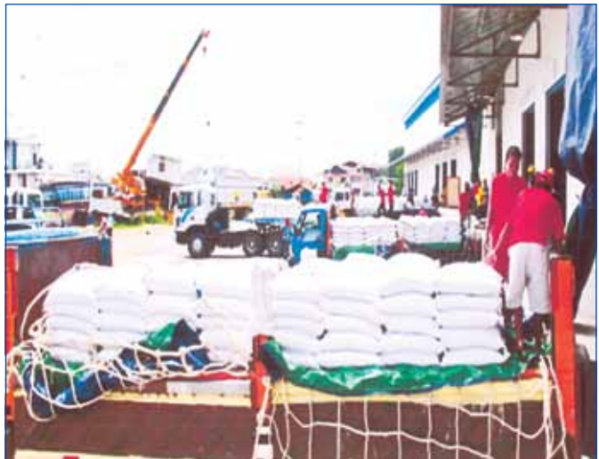
សកម្មភាពលើកដាក់អង្ករសម្រាប់នាំចេញទៅក្រៅប្រទេស

ចំពោះលទ្ធផលការងារបង្កើនផលឆ្នាំ២០១៣នេះ ក្រសួងកសិកម្ម បានឱ្យដឹងថាដំណាំស្រូវវស្សាមានចំនួន ២៥៦ ៧៧៦២ ហិកតា ស្មើនឹង ១០៧% លើសឆ្នាំមុន ៥៦ ០៦៨ ហិកតា ផ្ទៃដីអាចប្រមូលផលបានចំនួន ២ ៤៨៥ ៤៨៨ ហិកតា ហើយទិន្នផលជាមធ្យម ២ ៩២១ តោន ក្នុង ១ ហិកតា