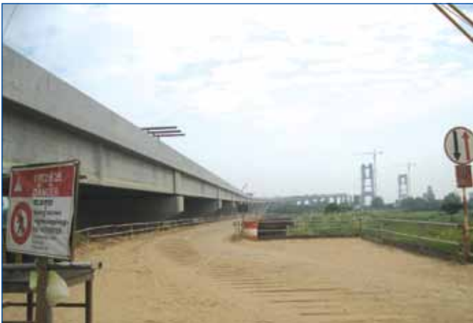
ការដ្ឋានស្ថាបនាស្ពានអ្នកលឿងប្រវែង ២,២២ គ.ម ស្ថិតក្នុងស្រុកលើកដែក ខេត្តកណ្តាល និងក្នុងស្រុកពាមរក៍ ខេត្តព្រៃវែង

ផ្លូវជាតិលេខ ៣៣ ប្រវែង ១៥,៦ គ.ម ពីកំពង់ត្រាច ព្រែកចាក ខេត្តកំពត សម្រេចបាន ១០០% ។ សាងសង់អគារត្រួតពិនិត្យឆ្លងកាត់ព្រំដែនព្រែកចាក ខេត្តកំពតសម្រេចបាន ៦៨% ។ គម្រោងជួសជុល និងថែទាំផ្លូវជាតិលេខ ៣ ប្រវែង ៥២ គ.ម ពីកំពត-វាលវេញ ខេត្តព្រះសីហនុសម្រេចបាន ១០០% ។ ផ្លូវជាតិលេខ ៥៦ កំណាត់ទី ១ ប្រវែង ២៩ គ.ម ពីសិរីសោភ័ណ ស្វាយចេក ខេត្តបន្ទាយមានជ័យ សម្រេចបាន ៦៤% ។