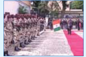
សម្តេចចក្រី ហេង សំរិន អញ្ជើញទៅបំពេញទស្សនកិច្ច នៅប្រទេសម៉ារ៉ុក និងប្រទេស កូឡុយំ