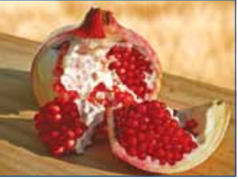
ផ្លែទទឹមផ្តល់ប្រយោជន៍ដល់សុខភាពមនុស្សគ្រប់វ័យ

ដើមទទឹមគឺជាប្រភេទរុក្ខជាតិម្យ៉ាងបែកបែកច្រើននិងមានដុះជាបន្តាផង រីឯស្លឹកវាដុះឆ្លាស់គ្នាខ្លះទៀតដុះសឹងទល់ទងទាំងអស់ ។ ចំណែកផ្កាទទឹមមានពណ៌ក្រហមស្រស់ មានដុះតែមួយ ឬបែកជាខ្លែងដុះចេញពីចន្លោះស្លឹកទាំងសង្វាង ។ ផ្លែទទឹមមានសំបកក្រាស់ រឹង មាន៨ ក្តែប គ្រាប់ទទឹមមានច្រើនគ្រាប់រវាងមូលដូចពងក្រពើ ខ្លះទៀតមានរាងជ្រុងដូចគ្រាប់ពេជ្រ ។ ដើមទទឹមគេសង្កេតឃើញមានដំបូងនៅពេលពេញបណ្តាប្រទេសនៅតំបន់ឥណ្ឌូចិនក្នុងលក្ខណៈដាំជាចម្ការ ឬលម្អផ្ទះ ។ ផ្លែទទឹមមានប្រភពដើមមកពីប្រទេសអាហ្វហ្កា