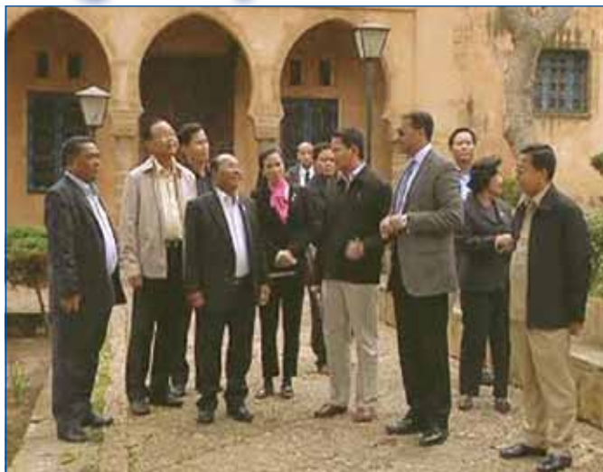
សម្តេចហត្ថមហាពញាចក្រី ហេង សំរិន ក្នុងឱកាសអញ្ជើញបំពេញទស្សនកិច្ចជាផ្លូវការ និងជាមិត្តភាពនៅប្រទេសម៉ារ៉ុក និងប្រទេសកូឡីវ៉ែរ

គណៈប្រតិភូជាន់ខ្ពស់រដ្ឋសភានៃព្រះរាជាណាចក្រកម្ពុជា ដឹកនាំដោយសម្តេចហត្ថមហាពញាចក្រី ហេង សំរិន ប្រធានរដ្ឋសភា បានអញ្ជើញបំពេញទស្សនកិច្ចជាផ្លូវការ និងជាមិត្តភាពនៅប្រទេសម៉ារ៉ុក និងប្រទេសកូឡីវ៉ែរ ក្នុងគោលបំណងពង្រឹង និងពង្រីកចំណងមិត្តភាព និងកិច្ចសហប្រតិបត្តិការរវាងរដ្ឋសភានៃព្រះរាជាណាចក្រកម្ពុជា-ម៉ារ៉ុក និងរដ្ឋសភានៃព្រះរាជាណាចក្រកម្ពុជា-កូឡីវ៉ែរ ឱ្យកាន់តែល្អប្រសើរថែមទៀត ។