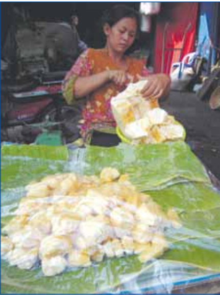
អ្នកលក់ផ្លែខ្មុរនៅក្នុងផ្សារ

ផ្លែខ្មុរគឺជាផ្លែឈើដែលមានក្លិនក្រអូប និងមានដើមកំណើតចេញពីភាគខាងលិចនិងខាងត្បូងប្រទេសឥណ្ឌា បង់ក្លាដេស ហ្វីលីពីន និងស្រីលង្កា ។