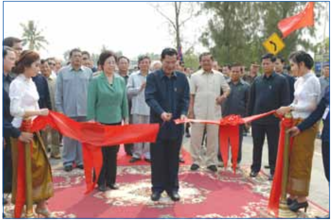
សម្តេចតេជោ ហ៊ុន សែន កាត់ខ្សែប្រសម្ព័ន្ធផ្លូវជាតិលេខ ៥៧ បេ ដែលតភ្ជាប់ពីស្រុកបវេល ខេត្តបាត់ដំបង ទៅតំបន់ព្រំដែន កម្ពុជា-ថៃ

សម្តេចបានបន្តទៀតថា ការដែលមកនិយាយនៅទីនេះក្នុងនាមជាសាធារណៈ