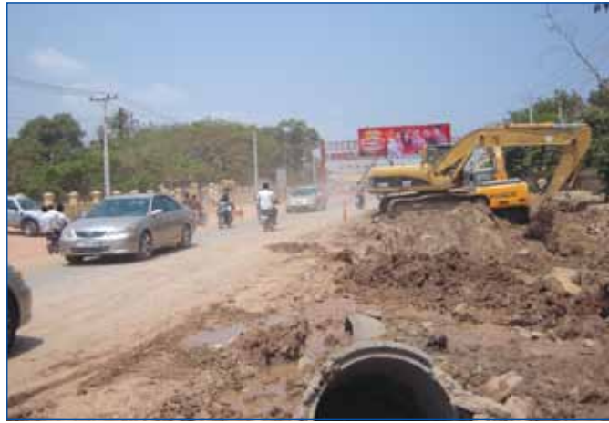
ការដ្ឋានស្ថាបនាពង្រីកកំណាត់ផ្លូវជាតិលេខ ៦ ប្រវែង ៤០,៤៨ គ.ម មាន ៤ គន្លងចាប់ពីគីឡូម៉ែត្រលេខ ៤ មុខក្រសួងសុខាភិបាលថ្មីដល់ផ្លូវកែង