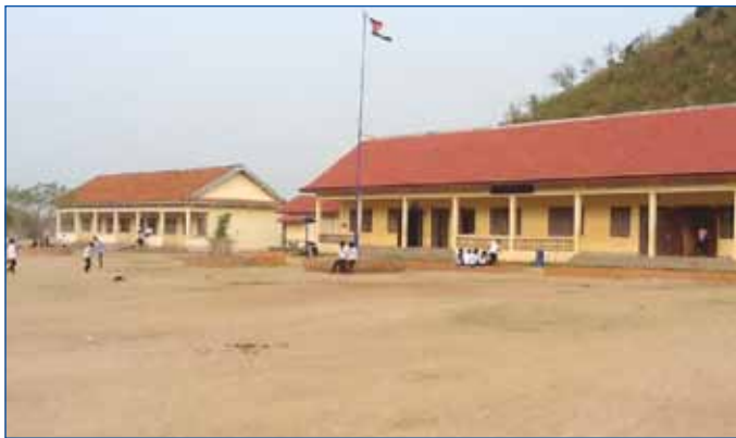
អគារសិក្សានៅក្នុងស្រុកជលគិរី ខេត្តកំពង់ឆ្នាំង