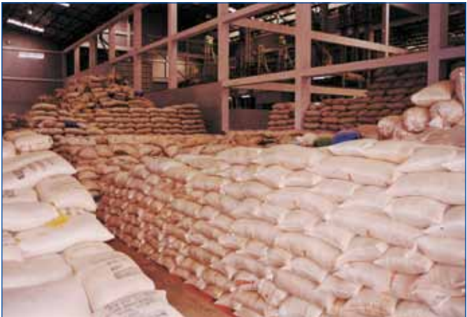
រោងម៉ាស៊ីនកិនស្រូវ សម្រាប់នាំអង្ករសម្រាប់នាំចេញទៅក្រៅប្រទេស

ចេញចូលតែមួយសម្រាប់បំពេញបែបបទនាំចេញអង្ករបានឱ្យដឹងថា បរិមាណអង្ករកម្ពុជាដែលបាននាំចេញទៅកាន់ទីផ្សារអន្តរជាតិមានចំនួនត្រឹមតែ ២១ ៥៣៦ តោនតែប៉ុណ្ណោះ ដោយចំនួននេះមានការធ្លាក់ចុះជាង ១៦% បើប្រៀបធៀបទៅនឹងខែមករា ឆ្នាំ ២០១៣ កន្លងទៅ ដែលមានចំនួនដល់ទៅ ២៥ ៧២៦ តោន ។