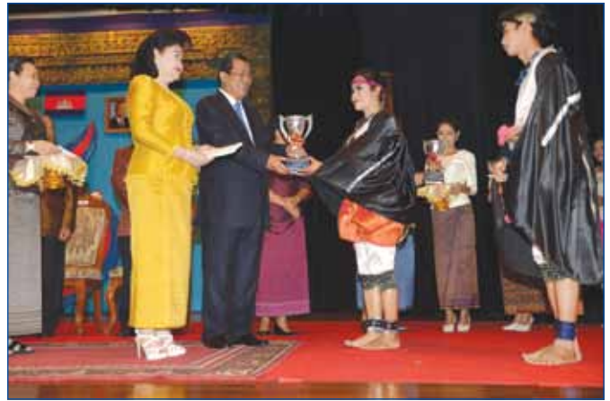
សម្តេចតេជោ ហ៊ុន សែន និងសម្តេចកិត្តិព្រឹទ្ធបណ្ឌិត អញ្ជើញជាអធិបតីក្នុងទិវាវប្បធម៌ជាតិ ៣ មីនា លើកទី ១៦ ឆ្នាំ ២០១៤ នៅសាលសន្និសីទចតុមុខ រាជធានីភ្នំពេញ

ក្នុងខែមីនា ឆ្នាំ ២០១៤ នេះ សម្តេចអគ្គមហាសេនាបតីតេជោ ហ៊ុន សែន នាយករដ្ឋមន្ត្រីនៃព្រះរាជាណាចក្រកម្ពុជា បានអញ្ជើញសម្តេចសមិទ្ធផលធំៗ មួយចំនួន ដែលក្នុងនោះមានការសម្តែងផ្លូវជាតិលេខ ៥៧ បេ ប្រវែងជាង ១០០ គ.ម សម្តែងដាក់ឱ្យប្រើប្រាស់វារីអគ្គិសនីស្ទឹងអារតែ ព្រមទាំងចូលរួម ក្នុងវិស័យវប្បធម៌និងអប់រំ ។ នៅគ្រប់ទីកន្លែងដែលសម្តេចបានចូលរួម សម្តេច បានណែនាំដល់បណ្តាក្រសួង ស្ថាប័ន និងអាជ្ញាធរអំពីការងារៗសំខាន់ៗជា ច្រើន ។