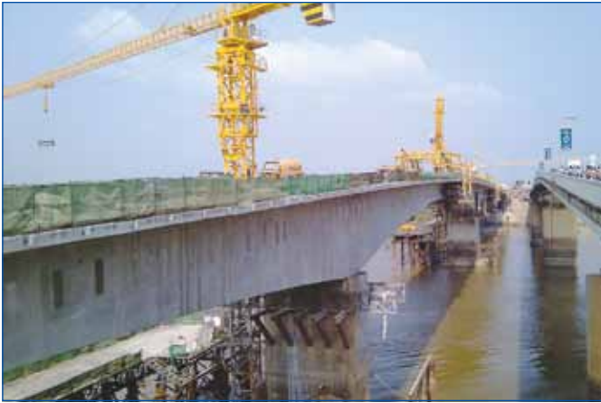
ការដ្ឋានស្ថាបនាស្ពានជ្រោយចង្វារទី ២ រាជធានីភ្នំពេញ ប្រវែង ៧១៩ ម៉ែត្រ

ក្រោមអធិបតីភាពសម្តេចតេជោ។ ផ្លូវភ្ជាប់ស្ពានតាខ្មៅប្រវែង ១១,១ គ.ម សម្រេចបាន ៤៣,៣៥% ។ ផ្លូវជាតិលេខ ៤១ ប្រវែង ៩៥,២៨ គ.ម ចាប់ពីផ្តល់ទទឹងដល់ជុំគីរីខេត្តកំពតសម្រេចបាន៩៧,១០% ។ ស្ពានជ្រោយចង្វារទី ២ រាជធានីភ្នំពេញ ប្រវែង ៧១៩ ម៉ែត្រ សម្រេចបាន ៨៣,៩៥% និងធ្វើពិធីចាក់បេតុងថ្មីមប្រអប់ស្ពានតភ្ជាប់គ្នានៃប្រឡោះជើងទម្រនៅថ្ងៃទី ៩ ខែមេសាខាងមុខក្រោមអធិបតីភាពសម្តេចតេជោ។ ផ្លូវជាតិលេខ ៩ ប្រវែង ១៤១,៦៨ គ.មចាប់ពីត្បែងមានជ័យ ខេត្តព្រះវិហារ-ថាឡាបរិវាត់ ខេត្តស្ទឹងត្រែង សម្រេចបាន ៩១,៥៨% ។ ស្ពានមេគង្គ ខេត្តស្ទឹងត្រែងប្រវែង ១.៧៣១ ម៉ែត្រ សម្រេចបាន ៩១,៩១ % ។ កំណាត់ផ្លូវជាតិលេខ ៧ បន្ត ប្រវែង ១៧១,៧៨ គ.ម ចាប់ពីសែនមនោរម្យ កោះព្រែកខេត្តមណ្ឌលគិរី-លំផាត់ តាអង់ ខេត្តរតនគិរី សម្រេចបាន ៤៤,០៤% ។ ផ្លូវជាតិលេខ ៤៤ ប្រវែង ១៣៩,៦១គ.ម ចាប់ពីច្បារមន ឱរ៉ាល់ ឧត្តុង្គ ខេត្តកំពង់ស្ពឺសម្រេចបាន ៤៥,៨៥% ។ កំណាត់ផ្លូវជាតិលេខ ៥ ប្រវែង ៣០,១៤៥ គ.ម ចាប់ពីភ្នំពេញដល់ព្រែកក្តាម សម្រេចបាន ១៧,៥០% និងកំណាត់ផ្លូវជាតិលេខ ៦ ប្រវែង ២៤៨,៥២ គ.ម ផ្តល់កែង-អង្រែង ខេត្តសៀមរាប សម្រេចបាន ១១,៦១% ។