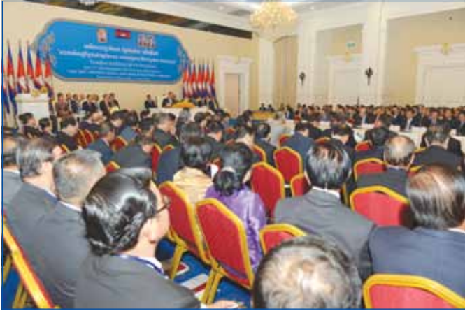
ទិដ្ឋភាពរួមនៃវេទិកាវាជរដ្ឋាភិបាល និងវិស័យឯកជនលើក ទី ១៧ នៅវិមានសន្តិភាព