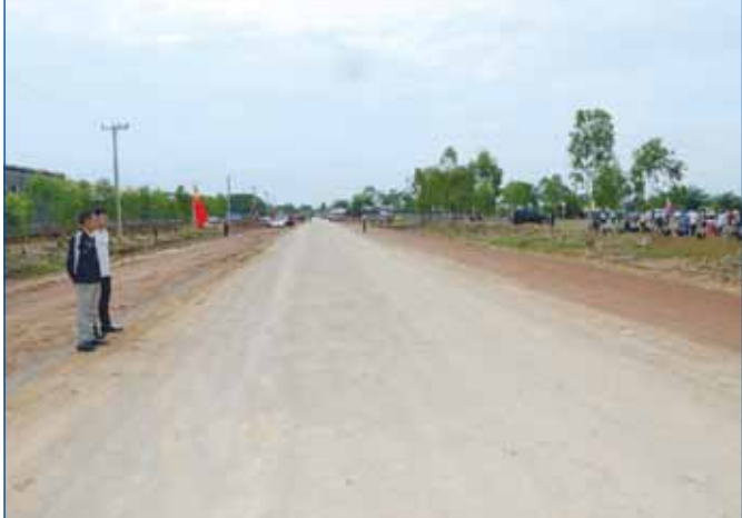
កំណាត់ផ្លូវជាតិលេខ ៤៤ ប្រវែង ១៣៩,៦១ គ.ម បំបែកពីផ្លូវជាតិលេខ ៤ ខេត្តកំពង់ស្ពឺ ឆ្ពោះទៅកាន់ស្រុកឧត្តុង្គជាប់ផ្លូវជាតិលេខ ៥

ខែមីនា(ផ្លូវជាតិលេខ ៦២ ប្រវែង ៦,០៥ គ.មចាប់ពីជើងភ្នំប្រាសាទព្រះ វិហារសម្រេចបាន៧៣,៨៧% ។ កំណាត់ផ្លូវជាតិលេខ ៦ ប្រវែង ៤០,៤៨ គ.ម មាន ៤ គន្លង ចាប់ពីគីឡូម៉ែត្រលេខ ៤ មុខក្រសួងសុខាភិបាលថ្មី-ផ្លូវ កែង សម្រេចបាន ៦៥,៧២% ។ ស្ថានភាពខ្លៅ ក្រុងភាពខ្លៅ ខេត្តកណ្តាល ប្រវែង ៨៥៥ ម៉ែត្រសម្រេចបាន ៩៧,៩២% និងធ្វើពិធីចាក់បេតុងថ្មីម ប្រ អប់ស្ថានភាពភ្ជាប់គ្នានៃប្រឡោះជើងទម្រនៅថ្ងៃទី ២ ខែមេសាខាងមុខ