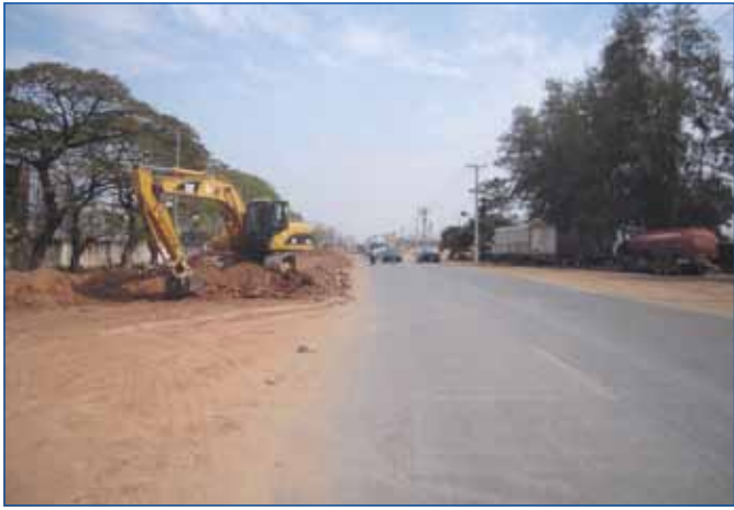
ការដ្ឋានស្ថាបនាពង្រីកកំណាត់ផ្លូវជាតិលេខ ៥ ចាប់ពី រាជធានីភ្នំពេញដល់ព្រែកក្តាមប្រវែង ៣០,១៤៥ គ.ម

ផ្អែកតាមរបាយការណ៍របស់ក្រសួងសាធារណការ និងដឹកជញ្ជូនបានបញ្ជាក់ឱ្យដឹងថា គិតមកត្រឹមដំណាច់ខែមករាឆ្នាំ ២០១៤ នេះ ការងារ ស្ថាន ផ្លូវ ដែលកំពុងអនុវត្តក្រោមគម្រោងធំៗក្នុងក្របខណ្ឌជំនួយអន្តរជាតិ បានសម្រេចលទ្ធផលជាផ្លែផ្កា ដែលក្នុងនោះគម្រោងមួយចំនួន កំពុងតែអនុវត្ត និងគម្រោងមួយចំនួនទៀតកំពុងតែរៀបចំ ដើម្បីនឹងអនុវត្ត ។ លទ្ធផលមានដូចខាងក្រោម :