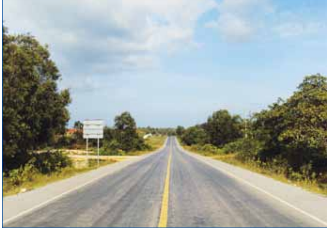
កំណាត់ផ្លូវជាតិលេខ ៣ ពីទីរួមខេត្តកំពតឆ្ពោះទៅកាន់វាលពេជ្រ ស្រុកព្រៃនប់ ខេត្តព្រះសីហនុ