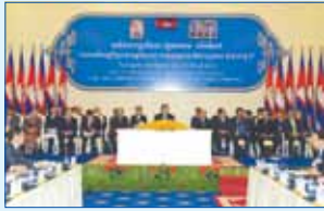
វេទិការាជរដ្ឋាភិបាល និងវិស័យឯកជនលើកទី ១៧ ក្រោមប្រធានបទ "សហគមន៍សេដ្ឋកិច្ចអាស៊ានឆ្នាំ ២០១៥ ....."