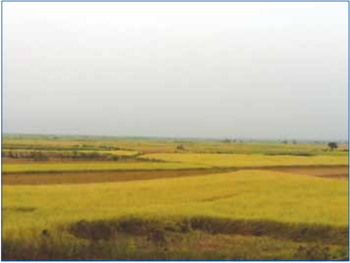
ភោគផលស្រូវរបស់ប្រជាកសិករស្រុកជលគិរី ខេត្តកំពង់ឆ្នាំង

យើងក្រឡេកមើលទៅអតីតរបស់ស្រុកជលគិរី ហើយប្រៀបធៀបមកនឹងអ្វីដែលមានក្នុងពេលបច្ចុប្បន្ន ទើបយើងដឹងថា តើមានអ្វីបានកើតឡើងនៅក្នុងស្រុកមួយនេះ ។ ស្រុកជលគិរីជាស្រុកមួយបង្កើតឡើងក្នុងជំនាន់ អតីតសាធារណរដ្ឋ ប្រជាមានិតកម្ពុជាឆ្នាំ ១៩៨៨ ហើយទិរ្វមស្រុកស្ថិតនៅប៉ែកខាងកើតនៃទិរ្វមខេត្តកំពង់ឆ្នាំង ដែលមានចម្ងាយប្រមាណ ៤៨ គីឡូម៉ែត្រ ។ ស្រុកនេះស្ថិតនៅក្នុងភូមិសាស្ត្រឃុំព្រៃត្រីដែលបំបែកចេញពីស្រុកកំពង់លែង ជាប់ព្រំប្រទល់ស្រុកបាធាយ ខេត្តកំពង់ចាម និងស្រុកបាយ័ន ខេត្តកំពង់ធំ ។ ជលគិរីជាស្រុកដែលមានលក្ខណៈ ភូមិសាស្ត្រពិសេស