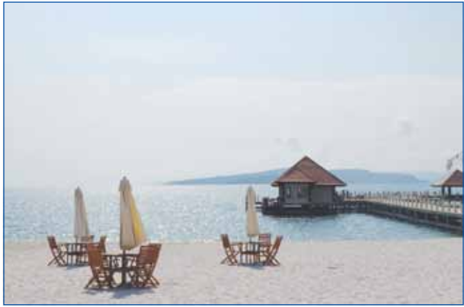
អាងស្តុកទឹកធំធំមួយ ជាកន្លែងកម្សាន្តនៅឆ្នេរសមុទ្រ នៅចេត្តកោះកុង

យើងពិតជាវិភាយណាស់ ដែលបានទៅទស្សនារយៈពេលខ្លីនៅក្នុងស្រុកបូទុមសាគរនាដើមឆ្នាំ២០១៦ នេះ និងបានទៅដល់តំបន់អភិវឌ្ឍន៍ដែលអ្នកស្រុកនៅទីនោះហៅថា ក្រុមហ៊ុនចិនញៀន កំពុងធ្វើការអភិវឌ្ឍតំបន់លំហែកាយទេសចរណ៍ខ្នាតធំមួយដ៏ទំនើប លើផ្ទៃដី