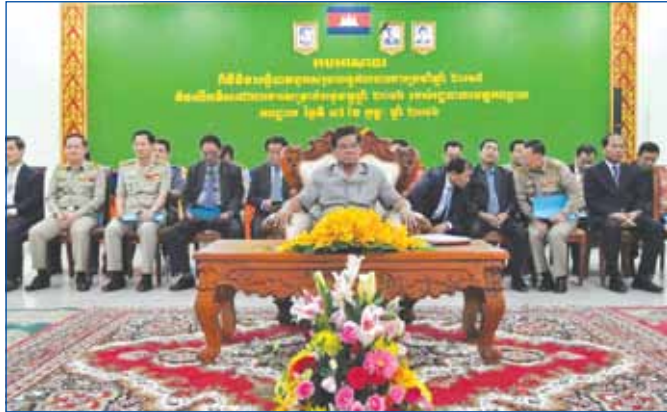
សម្តេចក្រឡាហោម ស ខេង នាយករដ្ឋមន្ត្រីស្តីទី និងជារដ្ឋមន្ត្រីក្រសួងមហាផ្ទៃ បានអញ្ជើញជាអធិបតីដ៏ខ្ពង់ខ្ពស់ក្នុងពិធីបិទសន្និបាតបូកសរុបការងារឆ្នាំ ២០១៥ និងលើកទិសដៅការងារឆ្នាំ ២០១៦ របស់ខេត្តកណ្តាល

រសៀលថ្ងៃទី ១៧ ខែកុម្ភៈ ឆ្នាំ ២០១៦ សម្តេចក្រឡាហោម ស ខេង នាយករដ្ឋមន្ត្រីស្តីទី និងជារដ្ឋមន្ត្រីក្រសួងមហាផ្ទៃ បានអញ្ជើញជាអធិបតីដ៏ខ្ពង់ខ្ពស់ក្នុងពិធីបិទសន្និបាតបូកសរុបការងារឆ្នាំ ២០១៥ និងលើកទិសដៅការងារឆ្នាំ ២០១៦ របស់ខេត្តកណ្តាល នាសាលាខេត្តកណ្តាល ។