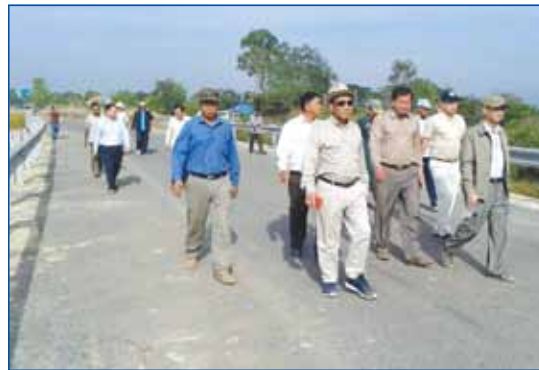
ថ្ងៃទី ២២ ខែកុម្ភៈ ឯកឧត្តម ម៉ែន ស៊ីម៉ែន សមាជិកគណៈកម្មាធិការកណ្តាលគណបក្សប្រជាជនកម្ពុជា ទេសរដ្ឋមន្ត្រី ឯកឧត្តម នឹម ប័ន្ទតារា តំណាងរាស្ត្រមណ្ឌលកំពត បានអញ្ជើញចូលរួមសម្ពោធផ្លូវថ្នល់ជាប់ទ្រូងប្រាសាទសាលាធម្មសភា ក្នុងវត្តអង្គចក ស្ថិតនៅឃុំត្រពាំងរាំង ស្រុកជុំគិរី ខេត្តកំពត ។