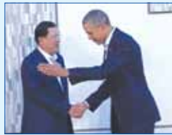
កម្ពុជាជំរុញឲ្យដោះស្រាយ រាល់បញ្ហាដោយសន្តិវិធី ក្នុងកិច្ចប្រជុំកំពូលអាមេរិកអាស៊ាន