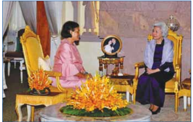
ព្រះអង្គម្ចាស់ក្សត្រី មហាចក្រី សិរិនថន យាងចូលក្រាបបង្គំគាល់ សម្តេចព្រះមហាក្សត្រី នរោត្តម មុនីនាថ សីហនុ

ក្នុងខែកុម្ភៈឆ្នាំ២០១៦ សម្តេចតេជោ ហ៊ុន សែន នាយករដ្ឋមន្ត្រីនៃ ព្រះរាជាណាចក្រកម្ពុជាបានទទួលព្រះរាជដំណើរបំពេញទស្សនកិច្ចជាផ្លូវ ការរបស់ ព្រះអង្គម្ចាស់ក្សត្រី មហាចក្រី សិរិនថន នៃព្រះរាជា- ណាចក្រថៃ តបតាមសេចក្តីអញ្ជើញរបស់សម្តេច ព្រមទាំងបានអញ្ជើញជា អធិបតីដ៏ខ្ពង់ខ្ពស់ក្នុងកម្មវិធីមួយចំនួនទៀត ។ ក្នុងកម្មវិធីទាំងនោះ ប្រមុខ រាជរដ្ឋាភិបាលបានផ្តល់នូវសារនយោបាយដ៏សំខាន់មួយចំនួនដែលទាក់ ទងទៅនឹងបញ្ហាជាតិ និងអន្តរជាតិ ។