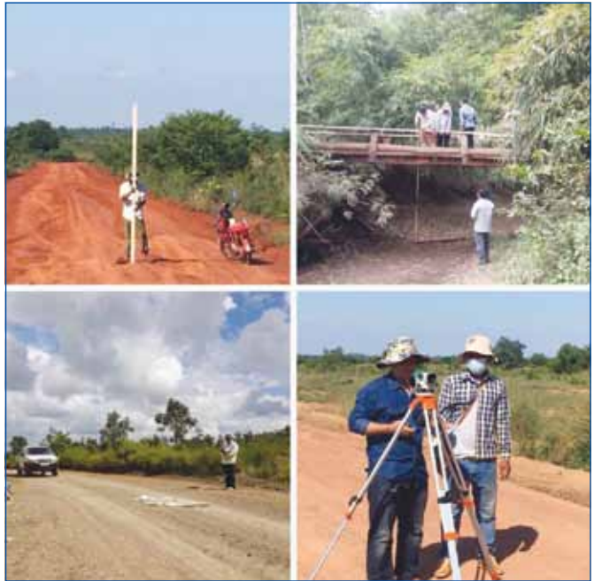
សកម្មភាពខ្លះៗ របស់មន្ត្រីវិស្វកម្មនៃនាយកដ្ឋានផ្លូវលំជនបទ និង មន្ទីរអភិវឌ្ឍន៍ជនបទរាជធានី-ខេត្ត ក្នុងការចុះសិក្សា និងត្រួតពិនិត្យគម្រោង មុនពេល និងកំពុងសាងសង់ ជួសជុល ថែទាំ ផ្លូវ ស្ថាន និងល្ង

ប្រសាសន៍ថា វិស័យ ហេដ្ឋារចនាសម្ព័ន្ធផ្លូវលំជនបទ គឺពិតជាបានរួម ចំណែកយ៉ាងសំខាន់ ក្នុងការសម្រួលការធ្វើចរាចរណ៍របស់ប្រជាពលរដ្ឋ នៅតាមមូលដ្ឋាន និងលើកស្ទួយស្ថានភាពសេដ្ឋកិច្ច ព្រមទាំងរួមចំណែក កាត់បន្ថយភាពក្រីក្ររបស់ប្រជាជន ។ ឯកឧត្តមបញ្ជាក់ថា ផែនការអភិ- វឌ្ឍន៍ផ្លូវលំជនបទនេះគឺឆ្លុះបញ្ចាំងអំពីវឌ្ឍនភាពការងារ បទពិសោធន៍ និង ការសិក្សារៀនសូត្រទៅលើបទដ្ឋានជំនាញបច្ចេកទេស សម្រាប់យកទៅ អភិវឌ្ឍន៍វិស័យផ្លូវលំជនបទប្រកបដោយគុណភាពខ្ពស់ និងមាននិរន្តរ- ភាពប្រើប្រាស់យូរអង្វែង។ ឯកឧត្តមបញ្ជាក់ថា ផ្លូវគឺជាសរសៃឈាមនៃ សេដ្ឋកិច្ច ដែលបានរួមចំណែកយ៉ាងធំធេងក្នុងការលើកស្ទួយស្ថានភាព ទាំងម៉ាក្រូសេដ្ឋកិច្ចនិងមីក្រូសេដ្ឋកិច្ចរបស់កម្ពុជាដែលតម្រូវឱ្យក្រសួងអភិ- វឌ្ឍន៍ជនបទបន្តធ្វើការសាងសង់ជួសជុលថែទាំ និងអភិវឌ្ឍផ្លូវលំជនបទ ឱ្យបានកាន់តែល្អប្រសើរថែមទៀត ។