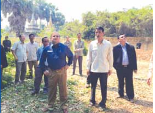
ថ្ងៃទី ១០ ខែកុម្ភៈ ឯកឧត្តម ខៀវ ភាព្យារិន្ទ សមាជិកគណៈកម្មាធិការកណ្តាលគណបក្សប្រជាជនកម្ពុជា រដ្ឋមន្ត្រីក្រសួងព័ត៌មាន និងជាប្រធានក្រុមការងារថ្នាក់កណ្តាលចុះស្រុកកោះសុទិន ខេត្តកំពង់ចាម បានអញ្ជើញជួបសំណេះសំណាលជាមួយពុទ្ធបរិស័ទចំណុះដើងវត្ត ព្រះសង្ឃវត្តពង្រ ក្នុងឃុំពង្រ ស្រុកកោះសុទិន ខេត្តកំពង់ចាម ។

ថ្ងៃទី ១៨ ខែកុម្ភៈ ឆ្នាំ ២០១៦ ឯកឧត្តម ងា សុផាវ៉ា សមាជិកគណៈកម្មាធិការកណ្តាលគណបក្សប្រជាជនកម្ពុជា រដ្ឋមន្ត្រីក្រសួងអភិវឌ្ឍន៍ជនបទ ដោយរួមសហការប្រតិបត្តិការជាមួយទីភ្នាក់ងារសហប្រតិបត្តិការអន្តរជាតិកូរ៉េ បានអញ្ជើញជាអធិបតីក្នុងពិធីបើកការដ្ឋានសាងសង់មជ្ឈមណ្ឌលបណ្តុះបណ្តាល"ចលនាកូមិធី"នៃគម្រោងអភិវឌ្ឍន៍ជនបទដោយប្រើប្រាស់វិធីសាស្ត្រ"ចលនាកូមិធី" នៅ ខេត្តកំពង់ស្ពឺ ។