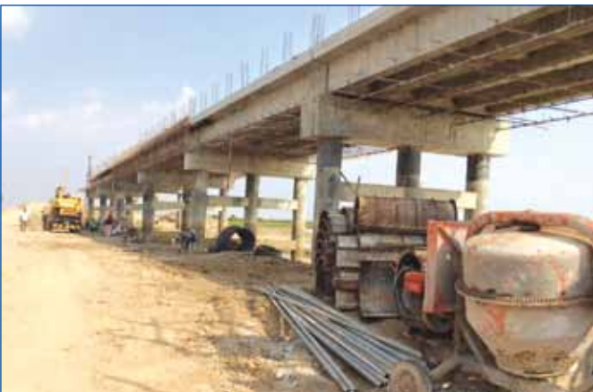
សកម្មភាពការងារកំពុងសាងសង់ស្ថានពោធិ៍រៀង ប្រវែងរហូតដល់ ១៧២ម ទទឹង ៨ ម ស្ថិតនៅក្នុងឃុំពោធិ៍រៀង ស្រុកពោធិ៍រៀង ខេត្តព្រៃវែង សម្រេចលទ្ធផលបានជិត ៦០% ដែលអនុវត្តដោយនាយកដ្ឋានផ្លូវលំជនបទ ប្រើ ប្រាស់ថវិការបស់រាជរដ្ឋាភិបាល