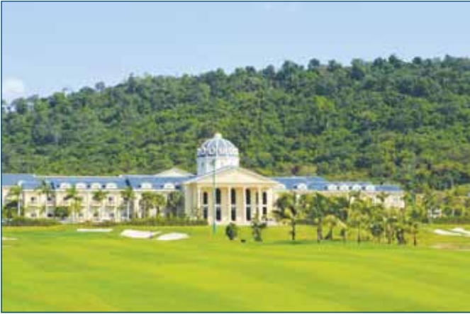
សណ្ឋាគារនិងជាទីស្នាក់ការក្រុមហ៊ុនញូញឿន