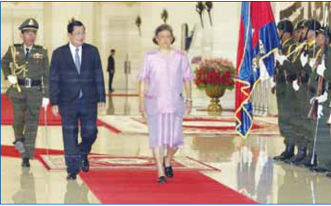
ពិធីបដិសណ្ឋារកិច្ចជាផ្លូវការថ្វាយ ព្រះអង្គម្ចាស់ក្សត្រី មហាបត្រី ស៊ីនឌន នៅវិមានសន្តិភាព

ថ្នាក់បរិញ្ញាបត្រលើគ្រប់មុខជំនាញ ដើម្បីឆ្លើយតបតម្រូវការរបស់ព្រះរាជាណាចក្រកម្ពុជា ដែលកំពុងមានការរីកចម្រើនយ៉ាងឆាប់រហ័សលើគ្រប់វិស័យហើយត្រូវការចាំបាច់នូវធនធានមនុស្ស ប្រកបដោយចំណេះវិជ្ជាដែលជាកម្លាំងជំរុញកំណើនសេដ្ឋកិច្ច និងបង្កើនកម្រិតជីវភាពប្រជាពលរដ្ឋនៅក្នុងខេត្តកំពង់ស្ពឺ និងខេត្តជិតខាង។ ព្រះអង្គម្ចាស់ក្សត្រីបានមានបន្ទូលបន្តថាការបញ្ចុះបញ្ចូលសិលាសាស្ត្រវិទ្យាស្ថានបច្ចេកវិទ្យាកំពង់ស្ពឺនាពេលនេះគឺជានិមិត្តរូបនៃកិច្ចសហប្រតិបត្តិការដ៏ល្អរវាងប្រទេសយើងទាំងពីរ។ ព្រះអង្គម្ចាស់សង្ឃឹមថា នៅពេលសាងសង់រួចយើងទាំងអស់គ្នានឹងបានឃើញវិទ្យាស្ថានអប់រំដែលសង់ឡើងក្នុងរូបភាពសាមញ្ញតែរឹងមាំសមស្រប ដែលអាចបម្រើការយ៉ាងល្អដល់យុវជន និងប្រជាជននៅក្នុងតំបន់យ៉ាងសមស្របបំផុត។ "ស្ថាប័នបច្ចេកវិទ្យានេះនឹងផ្តល់ភាពងាយស្រួលនិងជាការបង្ហាញឲ្យឃើញនូវការស្រឡាញ់រាប់អានមិត្តភាពដែលមិនអាចកាត់ថ្លៃបាន ដែលគួរណាស់ប្រទេសយើងទាំងពីរចែករំលែកឲ្យបានគង់វង្សស្ថិតស្ថេរចីរកាល"។