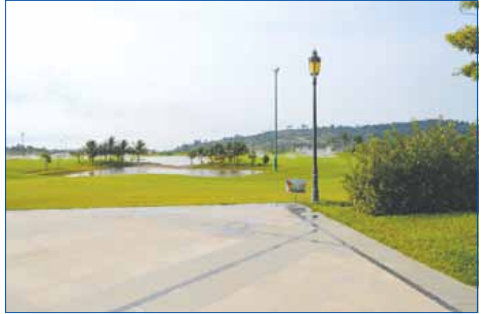
កន្លែងវាយកូនហ្គោលអាចលេងពេលយប់បាន