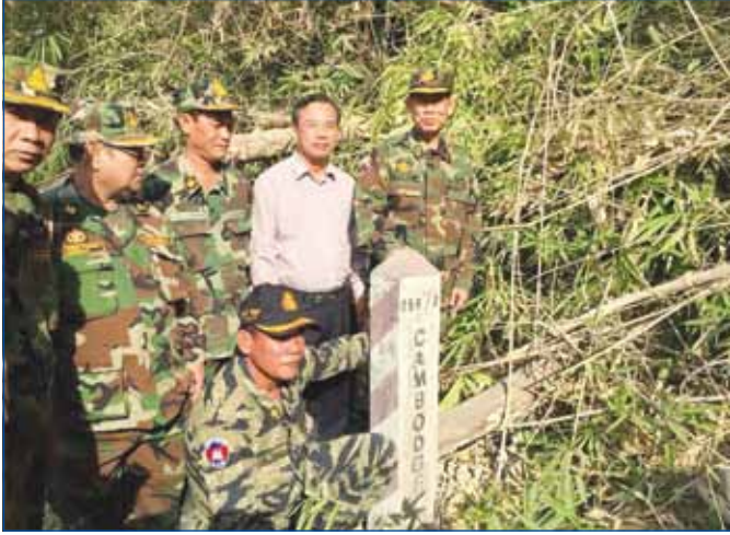
ក្រុមវិស្វកររបស់ក្រសួងអភិវឌ្ឍន៍ជនបទសហការជាមួយក្រសួងសេដ្ឋកិច្ច និងហិរញ្ញវត្ថុ និងវិស្វកម្មអគ្គបញ្ជាការ ចុះពិនិត្យស្ថានភាពផ្លូវប្រវែង ១២១គ.ម. តាមបណ្តោយព្រំដែនកម្ពុជា-ឡាវ ក្នុងខេត្តស្ទឹងត្រែង កាលពីថ្ងៃទី ១-២ ខែកុម្ភៈ ឆ្នាំ ២០១៦

ឯកឧត្តម ជាន សុផាវ៉ា រដ្ឋមន្ត្រីក្រសួងអភិវឌ្ឍន៍ជនបទបានមានប្រសាសន៍ក្នុងពិធីបិទសិក្ខាសាលាបូកសរុបសកម្មភាពការងារផ្លូវជនបទប្រចាំឆ្នាំ២០១៥ និងទិសដៅការងារឆ្នាំ២០១៦ កាលពីពេលថ្មីៗកន្លងមក