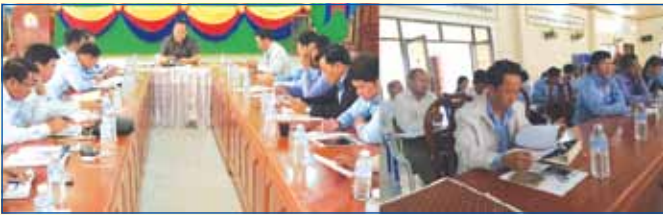
ឆ្នាំ ២០១៥ និងខែមករា ឆ្នាំ២០១៦ និងទិសដៅអនុវត្តបន្តខែកុម្ភៈ ឆ្នាំ២០១៦ ។ ៣-របាយការណ៍សកម្មភាពការងារយុវជនគណបក្សខេត្តប្រចាំខែធ្នូ ឆ្នាំ២០១៥ និងខែមករា ឆ្នាំ២០១៦ និងទិសដៅអនុវត្តបន្តខែកុម្ភៈ ឆ្នាំ២០១៦ ពីបណ្តាក្រុង ស្រុក និងផ្នែក។ ៤-ឆ្លងរបាយការណ៍បូកសរុបលទ្ធផលការងារយុវជនគណបក្សខេត្តឆ្នាំ ២០១៥ និង គ្រៀមរៀបចំសន្និបាតបូកសរុបលទ្ធផលការងារយុវជនគណបក្សខេត្តឆ្នាំ ២០១៥ និងទិសដៅអនុវត្តបន្តឆ្នាំ ២០១៦ និង៥-បញ្ហាផ្សេងៗ។