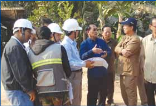
ថ្ងៃទី ១៤ ខែកុម្ភៈ ឯកឧត្តម ស៊ុយ សែម សមាជិកគណៈកម្មាធិការកណ្តាលគណបក្សប្រជាជនកម្ពុជា បានអញ្ជើញជួបសំណេះសំណាលជាមួយក្រុមយុវជនសិស្សានុសិស្សប្រមាណជាង ១០០០ នាក់ នៅវិទ្យាល័យបាក់កាន ស្រុកបាក់កាន ខេត្តពោធិសាត់ ក្នុងថ្ងៃទី១៤នៃក្តីស្រឡាញ់ ។

ថ្ងៃទី ១២ ខែកុម្ភៈ ឯកឧត្តម ត្រាំ អ៊ុំមតីត សមាជិកគណៈកម្មាធិការកណ្តាលគណបក្សប្រជាជនកម្ពុជា រដ្ឋមន្ត្រីក្រសួងសាធារណការ និងដឹកជញ្ជូន និងសហការីបានអញ្ជើញពិនិត្យផ្លូវជាតិលេខ ២៦៥F ចាប់ពីចំណុចបំបែកផ្លូវជាតិលេខ៦៣ត្រង់ម្លូត្រង់ម៉ុចចំណុចគីឡូម៉ែត្រ (04+500) ដល់ស្វាយធំ ឃុំកណ្តែក ស្រុកបាក់កាន នៅផ្លូវជាតិលេខ៦ត្រង់គីឡូម៉ែត្រ (305+200) មានប្រវែង ១១.២០០ ម៉ែត្រ ទទឹង ៦ ម៉ែត្រខេត្តសៀមរាប។ ផ្លូវនេះសាងសង់សម្រេចបាន៧០% ។