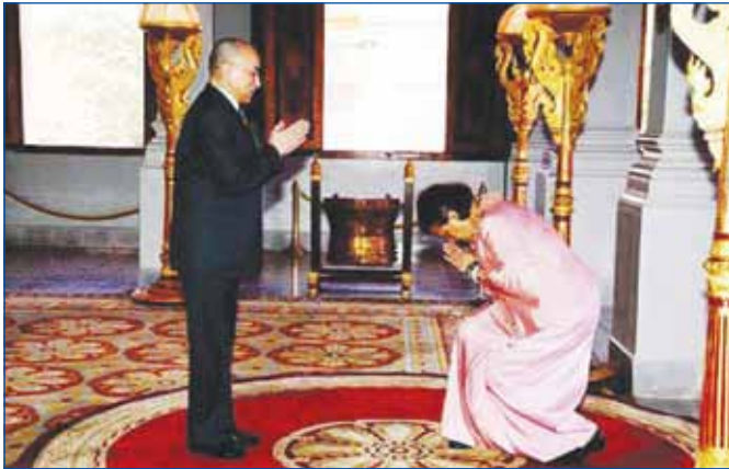
ព្រះអង្គម្ចាស់ក្សត្រី មហាចក្រី សិរិនថន យាងចូលក្រាបបង្គំគាល់ ព្រះករុណា ព្រះបាទសម្តេចព្រះ បរមនាថ នរោត្តម សីហមុនី ព្រះមហាក្សត្រនៃព្រះរាជាណាចក្រកម្ពុជា

* ការកាត់បន្ថយគម្លាតអតិថិជនខ្មែរគឺជាប់ឆ្លើយពីហេដ្ឋារចនាសម្ព័ន្ធ និង ការអភិវឌ្ឍធនធានមនុស្ស