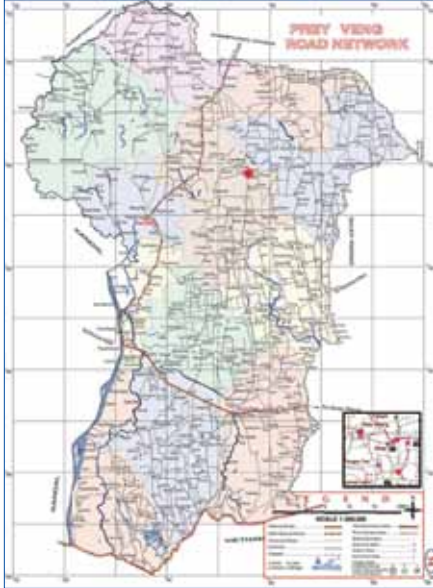
ផែនទីខេត្តព្រៃវែង និងទីតាំងភូមិព្រៃហារ ឃុំព្រៃ (google)

ប្រសិនបើជាដួងព្រៃលើវប្បធម៌ អរិយធម៌ជាតិ សាសន៍ខ្មែរបុរាណដ៏យូរលង់ រាប់សិបតំណ វ័យចំណាស់មួយ ត្រូវបានក្រសួងវប្បធម៌ និង វិចិត្រសិល្បៈកំណាយរកឃើញស្ថាប័នហោរជីក ធ្វើអំពីស្រទាប់ នៃស្ថានីយបុរេប្រវត្តិសាស្ត្រ "ភូមិ ព្រៃហារ" ស្ថិតក្នុងភូមិព្រៃហារ ឃុំព្រៃ ស្រុកព្រៃវែង ខេត្តព្រៃវែង ជាផ្លូវការលើកទី១ កាលពីថ្ងៃទី៣១ ខែមករា ដល់ថ្ងៃទី៨ ខែកុម្ភៈ ឆ្នាំ ២០០៨។ មន្ត្រី របស់ក្រសួងជីកបានស្ថាប័នហោរជីក និងកុលាល- ភាជន៍ រួមទាំងវត្តមានតម្លៃជាច្រើនមុខផ្សេងៗ ទៀត ។