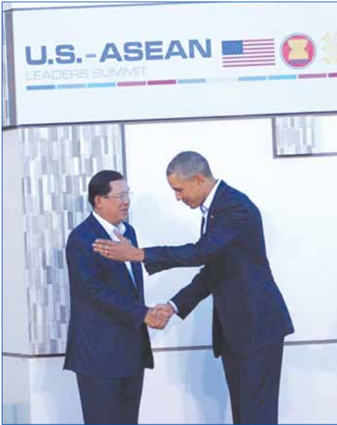
សម្តេចអគ្គមហាសេនាបតីតេជោ ហ៊ុន សែន នាយករដ្ឋមន្ត្រីនៃព្រះរាជាណាចក្រកម្ពុជា បានទទួលស្វាគមន៍រាក់ទាក់ក្នុងក្តៅពីសំណាក់ប្រធានាធិបតីនៃសហរដ្ឋអាមេរិក ឯកឧត្តម បារ៉ាក់ អូបាម៉ា

តបតាមសេចក្តីអញ្ជើញរបស់ឯកឧត្តម បារ៉ាក់ អូបាម៉ា ប្រធានាធិបតីនៃសហរដ្ឋអាមេរិក សម្តេចអគ្គមហាសេនាបតីតេជោ ហ៊ុន សែន នាយករដ្ឋមន្ត្រីនៃព្រះរាជាណាចក្រកម្ពុជា បានដឹកនាំប្រតិភូជាន់ខ្ពស់ទៅចូលរួមកិច្ចប្រជុំកំពូលអាមេរិកចាប់ពីថ្ងៃទី១៥-១៦ ខែកុម្ភៈ ឆ្នាំ២០១៦ ។ កិច្ចប្រជុំកំពូលពិសេស សហរដ្ឋអាមេរិកអាស៊ានដែលជាកិច្ចប្រជុំចម្រៀកលើកទី ១ ក្រោមប្រធានបទ "ការលើកកម្ពស់ការផ្តួចផ្តើម និងសហគ្រិនភាពនៃសហគមន៍សេដ្ឋកិច្ចអាស៊ាន " បានប្រារព្ធធ្វើបើកជាផ្លូវការនៅមជ្ឈមណ្ឌលSunnylandsក្នុងទីក្រុងRancho Mirageរដ្ឋកាលីហ្វ័រញ៉ា សហរដ្ឋអាមេរិក នៅថ្ងៃទី ១៥កុម្ភៈ ម៉ោងនៅទីក្រុង Rancho Mirage ត្រូវនឹងព្រឹកថ្ងៃទី១៦កុម្ភៈម៉ោងនៅក្នុងប្រទេសកម្ពុជា។ បណ្តាមេដឹកនាំអាស៊ានដែលចូលរួមក្នុងនោះរួមមាន ឯកឧត្តមអគ្គលេខាធិការអាស៊ាន ឯកឧត្តមអនុប្រធានាធិបតីនៃសាធារណរដ្ឋសហភាពមីយ៉ាន់ម៉ា ឯកឧត្តមនាយករដ្ឋមន្ត្រីវៀតណាម ចៀន តាន់ឃ័ង ឯកឧត្តមឧត្តមសេនីយ៍ ប្រាយុទ្ធ ចាន់អូនា នាយករដ្ឋមន្ត្រីថៃ ឯកឧត្តម លី ស៊ានលុច នាយករដ្ឋមន្ត្រីសិង្ហបុរី ឯកឧត្តមនាយករដ្ឋមន្ត្រីម៉ាឡេស៊ី ណាដីប រ៉ាហ្សាក់ សម្តេចអគ្គមហាសេនាបតីតេជោ ហ៊ុន សែន នាយករដ្ឋមន្ត្រីនៃព្រះរាជាណាចក្រកម្ពុជា ព្រះករុណា ស៊ីលតុង ហាវី ហានសានណាដូ ធីល ហ្គានស នាយករដ្ឋមន្ត្រីប្រុយណេដារូស្សាឡាម ឯកឧត្តម ចូកូ ឌីដូដូ ប្រធា