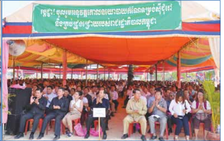
សម្តេចអគ្គមហាពញាចក្រី ហេង សំរិន ប្រធានរដ្ឋសភានៃព្រះរាជាណាចក្រកម្ពុជាប្រធានកិត្តិយសគណបក្សប្រជាជនកម្ពុជា ក្នុងឱកាសអញ្ជើញជាអធិបតីដ៏ខ្ពង់ខ្ពស់ក្នុងពិធីសម្តោង "ភូមិអភិវឌ្ឍន៍សម្តេចអគ្គមហាពញាចក្រី ហេង សំរិន ថ្មីក្រាច" និងពិធីប្រគល់ ផ្ទះចំនួន ៨១ ខ្នងជូនប្រជាពលរដ្ឋដែលក្រខ្សត់នៅភូមិថ្មីក្រាច ឃុំកក់ ស្រុកពញាក្រែក ខេត្តត្បូងឃ្មុំ