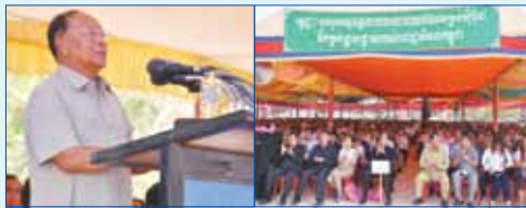
សម្តេចពញាចក្រី ហេង សំរិន សម្តេចក្រុមហ៊ុនអភិវឌ្ឍន៍ និងប្រគល់ផ្ទះចំនួន ៨១ ខ្នង ជូនប្រជាពលរដ្ឋ