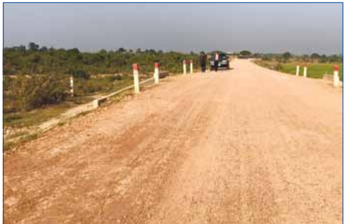
ផ្លូវក្រាលគ្រួសក្រហមមួយខ្សែប្រវែង ៣៧០០ ម៉ែត្រ និងល្ង ៤ កន្លែង ក្នុងឃុំសំបូរមាស ស្រុកមុខកំពូលខេត្តកណ្តាល ស្ថាបនាដោយក្រសួងអភិវឌ្ឍន៍ជនបទ

ប្រសាសន៍ថា វិស័យ ហេដ្ឋារចនាសម្ព័ន្ធផ្លូវលំជនបទ គឺពិតជាបានរួម ចំណែកយ៉ាងសំខាន់ ក្នុងការសម្រួលការធ្វើចរាចរណ៍របស់ប្រជាពលរដ្ឋ នៅតាមមូលដ្ឋាន និងលើកស្ទួយស្ថានភាពសេដ្ឋកិច្ច ព្រមទាំងរួមចំណែក កាត់បន្ថយភាពក្រីក្ររបស់ប្រជាជន ។ ឯកឧត្តមបញ្ជាក់ថា ផែនការអភិ- វឌ្ឍន៍ផ្លូវលំជនបទនេះគឺឆ្លុះបញ្ចាំងអំពីវឌ្ឍនភាពការងារ បទពិសោធន៍ និង ការសិក្សារៀនសូត្រទៅលើបទដ្ឋានជំនាញបច្ចេកទេស សម្រាប់យកទៅ អភិវឌ្ឍន៍វិស័យផ្លូវលំជនបទប្រកបដោយគុណភាពខ្ពស់ និងមាននិរន្តរ- ភាពប្រើប្រាស់យូរអង្វែង។ ឯកឧត្តមបញ្ជាក់ថា ផ្លូវគឺជាសរសៃឈាមនៃ សេដ្ឋកិច្ច ដែលបានរួមចំណែកយ៉ាងធំធេងក្នុងការលើកស្ទួយស្ថានភាព ទាំងម៉ាក្រូសេដ្ឋកិច្ចនិងមីក្រូសេដ្ឋកិច្ចរបស់កម្ពុជាដែលតម្រូវឱ្យក្រសួងអភិ- វឌ្ឍន៍ជនបទបន្តធ្វើការសាងសង់ជួសជុលថែទាំ និងអភិវឌ្ឍផ្លូវលំជនបទ ឱ្យបានកាន់តែល្អប្រសើរថែមទៀត ។