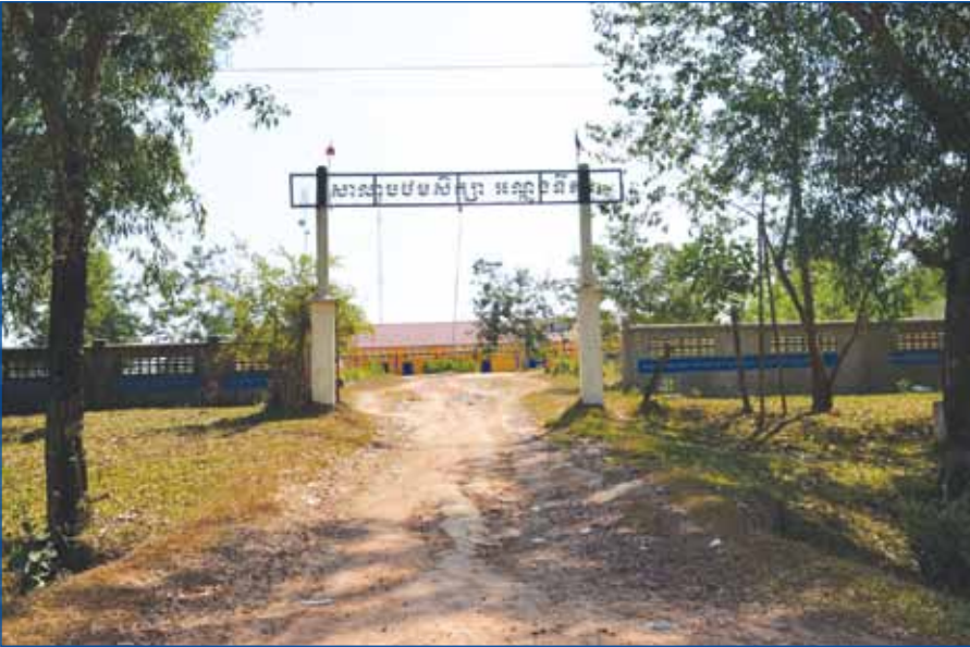
សាលាបឋមសិក្សា អណ្តូងទឹក

កាលពី ១០ ឆ្នាំមុនដែរ មិនទាន់មានការអភិវឌ្ឍ ដែលពេលនោះក្រុមហ៊ុន ញូញ៉េន មិនទាន់មក ដល់ ឃើញថាប្រជាពលរដ្ឋយើងមានការលំបាក ពិបាកខ្លាំងនោះ គឺថាយើងអត់ទាន់មានហេដ្ឋារចនាសម្ព័ន្ធផ្លូវគោកទំនាក់ទំនងគ្នាបាន។ អញ្ជឹង ប្រជាពលរដ្ឋរស់នៅដោយដុំៗ បានន័យថាបួន ដប់គ្រួសារទៅនៅម្តុំ ២០ ទៅ ៣០ គ្រួសារ នៅម្តុំ អត់មាននៅតភ្ជាប់គ្នាទេ។ ពេលយប់ព្រលប់ ឈឺ ថ្នាត់ ត្រូវការប្រើប្រាស់ទូក ឬអូរទៅកំពង់សោម ជួនកាលឆ្លងទន្លេអាចស្លាប់តាមផ្លូវក៏មាន ដោយ សារខែវស្សាការធ្វើដំណើរតាមផ្លូវទឹក មានការ លំបាករលកខ្លាំង ។ ដូច្នេះក្រោយពីការអភិវឌ្ឍ មកគោលនយោបាយរបស់រាជរដ្ឋាភិបាល បាន ដឹកនាំត្រឹមត្រូវធ្វើឲ្យមូលដ្ឋានមានការរីកចម្រើន ។ ក្នុងឆ្នាំ ២០១៦ នេះ នៅស្រុកបូទុមសាគរ ទាំង មូល នឹងមានភ្លើងអគ្គិសនីដែលមានតម្លៃថោក ប្រើប្រាស់គ្រប់ភូមិទាំងអស់ ។ ពីព្រោះឥឡូវនេះ យើងបានប្រើភ្លើងតម្លៃថោក បាន ៧ ភូមិហើយ នៅសល់ ១៤ ភូមិទៀត។ ក្នុង ១៤ ភូមិនេះ ខាង ក្រសួងរ៉ែ និងថាមពលកំពុងតែតបណ្តាញមេចូល អាចនឹងរួចរាល់នៅពាក់កណ្តាលឆ្នាំ ២០១៦ នេះ ។