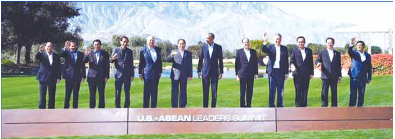
ប្រមុខរដ្ឋ និងប្រមុខរាជរដ្ឋាភិបាល ក្នុងកិច្ចប្រជុំកំពូលពិសេស សហរដ្ឋអាមេរិកអាស៊ាននៅមជ្ឈមណ្ឌល Sunnylands ក្នុងទីក្រុង Rancho Mirage រដ្ឋកាលីហ្វ័រញ៉ា សហរដ្ឋអាមេរិក

ប្រឆាំងនឹងបញ្ហាផ្សេងៗដែលទាក់ទិនទៅនឹងសន្តិសុខរបស់ពិភពលោក។