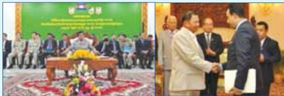
សម្តេចក្រឡាហោម ស ខេង នាយករដ្ឋមន្ត្រីស្តីទីរំលឹកមន្ត្រីខេត្ត..... សម្តេចវិបុលសេនាភក្តី សាយ ឈុំ ប្រធានព្រឹទ្ធសភា អនុញ្ញាតឱ្យ....