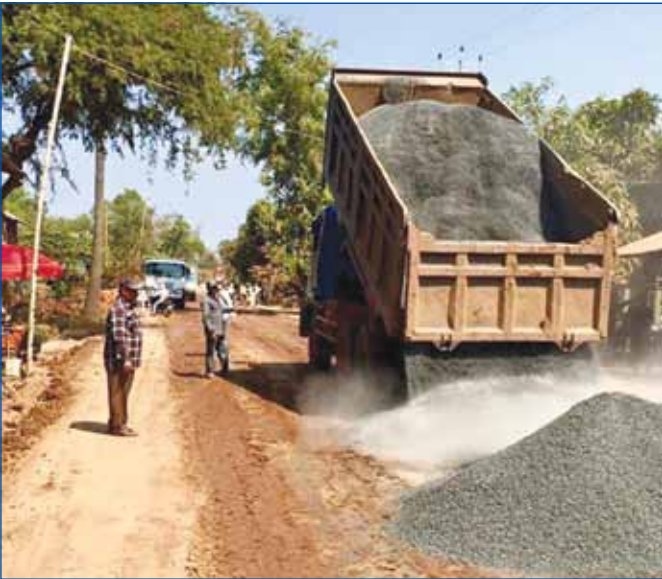
គ្រឿងចក្រកំពុងបន្តការងារសាងសង់គម្រោងផ្លូវក្រាលបេតុង ប្រវែង ១១ ៣០០ ម យ៉ាងសកម្ម ដែលចាប់ពីគល់ស្ថានគីស្សណានៃឃុំទន្លេបិទ រហូតដល់ឃុំ ពាមជីលាំង ស្រុកត្បូងឃ្មុំ ខេត្តត្បូងឃ្មុំ

ចំនួន ៧០០លានរៀល និងថវិកាបដិភាគ RIP3 ចំនួន ៤.៨០០ លានរៀល ។ របាយការណ៍របស់ក្រសួងអភិវឌ្ឍន៍ជនបទ បានឲ្យដឹងទៀតថា សម្រាប់ការងារឆ្នាំ ២០១៥ មានការងារសាងសង់ជួសជុល និងកែលម្អផ្លូវ ក្រោមគម្រោងវិនិយោគផ្ទាល់មានចំនួន ៨២ គម្រោង ប្រវែងចំនួន ៧០៣ គីឡូម៉ែត្រ និងសំណង់សិល្បការចំនួន ៧៧០ កន្លែង។ គម្រោងវិនិយោគ ផ្ទាល់ និងគម្រោងទឹកជំនន់មានចំនួន ៦០ គម្រោងប្រវែងសរុប ៤៨២ ម៉ែត្រ និងសំណង់សិល្បការចំនួន ៦៤១ កន្លែងអនុវត្តបាន ១០០ % ។ មន្ត្រីនៃ នាយកដ្ឋានផ្លូវលំជនបទនៃក្រសួងអភិវឌ្ឍន៍ជនបទ បានបញ្ជាក់ថា ហេដ្ឋា- រចនាសម្ព័ន្ធផ្លូវ ជនបទគឺជាវិស័យអាទិភាពដ៏សំខាន់មួយ ដែលរាជរដ្ឋាភិ- បាលកំពុងយកចិត្តទុកដាក់ ហើយជាទិសដៅសម្រាប់អនុវត្តការងារបន្ត នៅក្នុងឆ្នាំ ២០១៦ នេះមន្ត្រីជំនាញនឹងខិតខំចុះសិក្សាកំណត់អាទិភាពផ្លូវ ថែទាំ និងអភិវឌ្ឍន៍ពង្រឹងការត្រួតពិនិត្យសំណង់ការដ្ឋានផ្លូវលំនៅតាមជន បទដើម្បីធានាបាននូវគុណភាព ប្រសិទ្ធភាពកាន់តែខ្ពស់ថែមទៀតក្នុងការ ប្រើប្រាស់ និងរួមចំណែកកាត់បន្ថយភាពក្រីក្រនៅតាមតំបន់ជនបទ ។