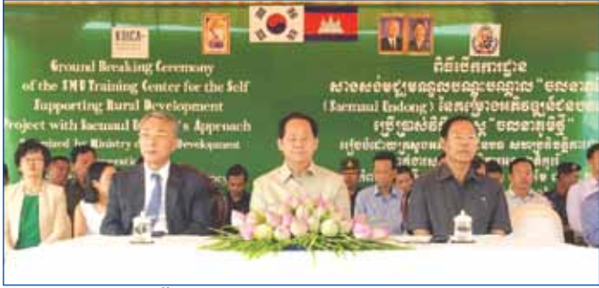
ឯកឧត្តម ជាន សុផាវ៉ា រដ្ឋមន្ត្រីក្រសួងអភិវឌ្ឍន៍ជនបទ អញ្ជើញជាអធិបតីក្នុងពិធីបើកការដ្ឋានសាងសង់មជ្ឈមណ្ឌលបណ្តុះបណ្តាល "ចលនាភូមិថ្មី" នៃគម្រោងអភិវឌ្ឍន៍ជនបទដោយប្រើប្រាស់វិធីសាស្ត្រ "ចលនាភូមិថ្មី" នៅខេត្តកំពង់ស្ពឺ ដោយបានការរួមសហការប្រតិបត្តិការជាមួយទីភ្នាក់ងារសហប្រតិបត្តិការអន្តរជាតិកូរ៉េ

រាជរដ្ឋាភិបាលសម្រាប់នីតិកាលទី៥ ដឹកនាំដោយសម្តេចអគ្គមហាសេនាបតីតេជោ ហ៊ុន សែន បាននិងកំពុងបន្តជំរុញអនុវត្តកម្មវិធីកំណែទម្រង់ស៊ីជម្រៅ និងទូលំទូលាយ ប្រកបដោយផ្លែផ្កាដែលបានធ្វើឲ្យសេដ្ឋកិច្ចរបស់កម្ពុជាកាន់តែមានភាពរឹងមាំឡើង ហើយអាចនឹងធានាសម្រេចគោលដៅនៃកំណើនសេដ្ឋកិច្ចក្នុងអត្រា៧% ក្នុងបណ្តាឆ្នាំតទៅមុខទៀត ។ ដើម្បីចូលរួមសម្រេចបាននូវគោលដៅនេះវិស័យអភិវឌ្ឍន៍ជនបទបានដាក់ទិសដៅផែនការអភិវឌ្ឍន៍ហេដ្ឋារចនាសម្ព័ន្ធ ដោយពង្រីកការអភិវឌ្ឍហេដ្ឋារចនាសម្ព័ន្ធផ្លូវថ្នល់ឆ្ពោះទៅតំបន់ជាប់ស្រយាល និងតំបន់ជាប់ព្រំដែន ដើម្បីរួមចំណែកពន្លឿនកិច្ចអភិវឌ្ឍន៍ និងជំរុញកំណើនសេដ្ឋកិច្ច ។ តាមផែនការនៅក្នុងឆ្នាំ ២០១៦ នេះ ក្រសួងអភិវឌ្ឍន៍ជនបទគ្រោងនឹងសាងសង់ជួសជុល និងកែលម្អផ្លូវលំជនបទ មានចំនួនសរុប ៧៦ គម្រោង ដែលនឹងចំណាយថវិកាជាង ២៥៤ ៣៩១ លានរៀល ។