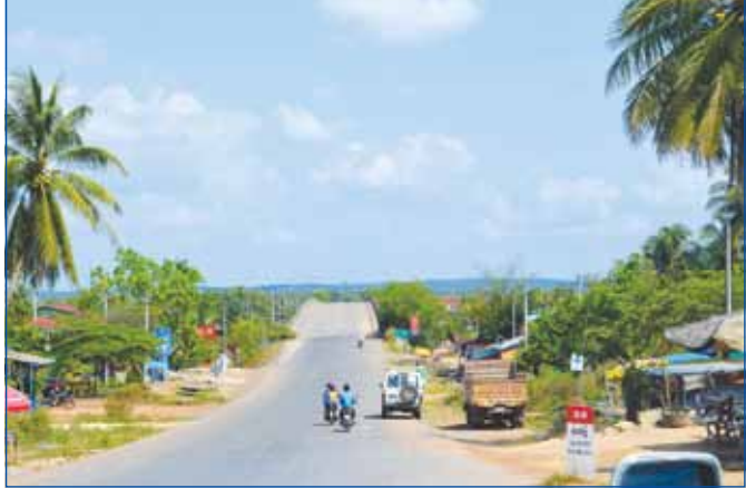
ទីប្រជុំជនស្រុកបូទុមសាគរ