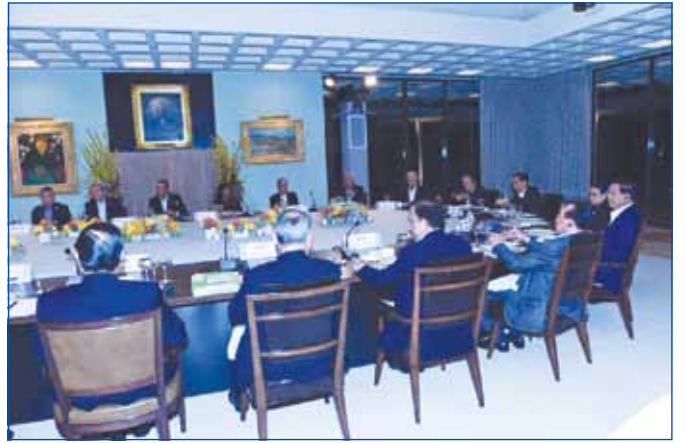
កិច្ចប្រជុំកំពូលពិសេស សហរដ្ឋអាមេរិកអាស៊ានដែលជាកិច្ចប្រជុំចម្លៀតលើកទី ១ ក្រោមប្រធានបទ "ការលើកកម្ពស់ការផ្តួចផ្តើម និងសហគ្រិនភាពនៃសហគមន៍សេដ្ឋកិច្ចអាស៊ាន" បានប្រារព្ធពិធីបើកជាផ្លូវការនៅមជ្ឈមណ្ឌល Sunnylands ក្នុងទីក្រុង Rancho Mirage រដ្ឋកាលីហ្វ័រញ៉ា សហរដ្ឋអាមេរិក