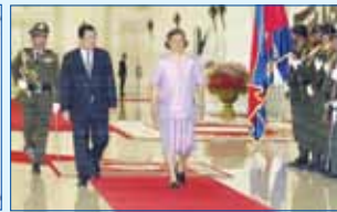
សម្តេចតេជោ : ចំណង់មិត្តភាព កម្ពុជា-ថៃ កាន់តែមានភាពល្អប្រសើរឡើង * ល្មមសងយុត្តិធម៌សម្រាប់ខ្ញុំហើយ..... * ការកាត់បន្ថយគម្លាតអភិវឌ្ឍន៍គឺចាប់....