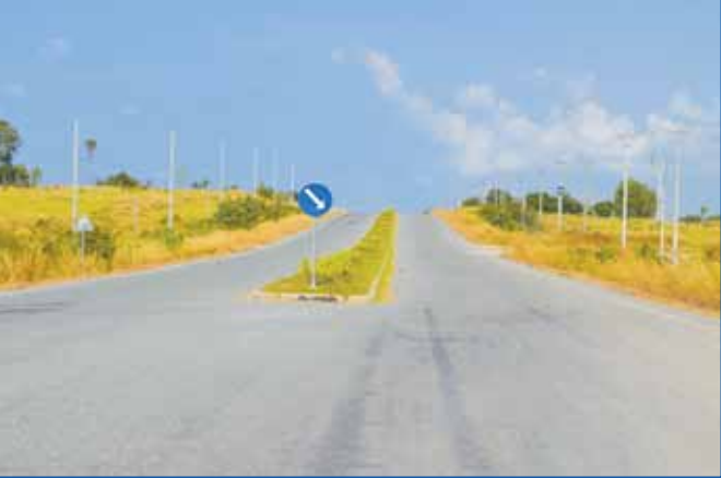
ផ្លូវចូលទៅកាន់ស្នាក់ការក្រុមហ៊ុនញៀន

ក្រុមហ៊ុនញៀន។ នេះទីនេះយើងបានឃើញជាហូរហែរនូវការសាងសង់អគារ អាងទឹកធំៗនៅជាប់នឹងផ្លូវក្រាលកៅស៊ូនេះ និងទេសភាពដ៏ស្រស់ស្អាតគួរឲ្យគយគន់មិនចេះណាយ នោះគឺទេសភាពព្រៃភ្នំដ៏ខ្សៀវស្រងាត់ ជាមួយនឹងខ្យល់អាកាសពីសមុទ្រ និងសន្សើមធ្លាក់នៅពេលព្រឹក