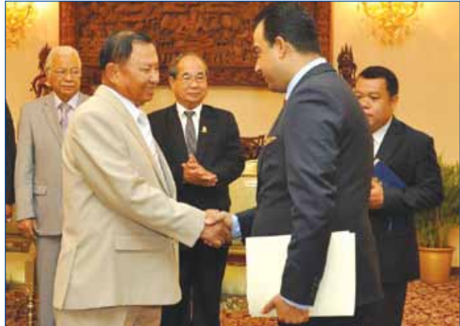
សម្តេចវិបុលសេនាភក្តី សាយ ឈ័យ ប្រធានព្រឹទ្ធសភានៃព្រះរាជាណាចក្រកម្ពុជា អនុញ្ញាតឱ្យគណៈប្រតិភូគណៈកម្មាធិការសិទ្ធិមនុស្សនៃសហភាពអន្តរសភា ចូលជួបសម្តែងការគួរសម

ព្រឹកថ្ងៃទី ១៥ ខែកុម្ភៈ ឆ្នាំ ២០១៦ នៅវិមានព្រឹទ្ធសភា សម្តេចវិបុលសេនាភក្តី សាយ ឈ័យ ប្រធានព្រឹទ្ធសភានៃព្រះរាជាណាចក្រកម្ពុជា បានអនុញ្ញាតឱ្យគណៈប្រតិភូគណៈកម្មាធិការសិទ្ធិមនុស្សនៃសហភាពអន្តរសភា (អាយភីយូ) ចូលជួបសម្តែងការគួរសម ។