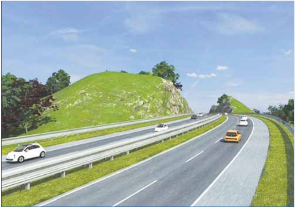
គំនូរប្លង់គម្រោងអភិវឌ្ឍន៍ផ្លូវល្បឿនលឿន (Expressway) ពីរាជធានីភ្នំពេញទៅកាន់ខេត្តព្រះសីហនុ

មកដល់ពេលនេះ រាជរដ្ឋាភិបាលបានបង្ហាញ មហិច្ឆតាមួយថ្មីទៀតដោយគ្រោងអភិវឌ្ឍ ផ្លូវល្បឿនលឿន (Expressway) ពីរាជធានីភ្នំពេញទៅកាន់ខេត្តព្រះសីហនុ ដែលរំពឹងថា នឹងត្រូវចាប់ផ្តើមនៅចុងឆ្នាំ ២០១៦ នេះ ក្នុងគម្រោងទឹកប្រាក់ចំណាយ ១,៦ ពាន់លានដុល្លារអាមេរិក ដើម្បីសម្រួលចរាចរដឹកជញ្ជូន ដែលជាផ្លូវរៀងសេដ្ឋកិច្ចដ៏ធំ ទៅកាន់កំពង់ផែ