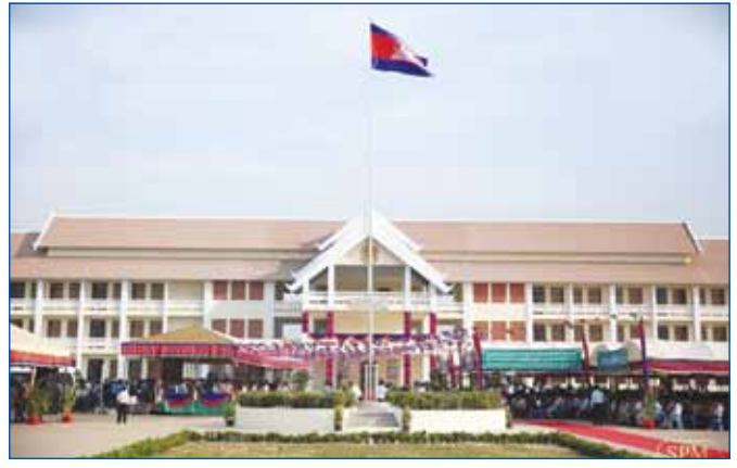
សម្តេចអគ្គមហាសេនាបតីតេជោ ហ៊ុន សែន នាយករដ្ឋមន្ត្រីនៃព្រះរាជាណាចក្រកម្ពុជា កាត់ខ្សែបួសម្តោចដាក់ឲ្យប្រើប្រាស់ជាផ្លូវការ សាកលវិទ្យាល័យ ហេង សំរិន ក្បែរភ្នំពេញ នៅខេត្តក្បែរភ្នំពេញ

សម្តេចតេជោបានបន្ថែមទៀតថា មានការធ្វើអត្ថប្រយោជន៍ជាខ្ពស់នា- យករដ្ឋមន្ត្រីកម្ពុជា លោក ហោ ណាំហុង រដ្ឋមន្ត្រីការបរទេសទៅចិន ដោយប្រញាប់ប្រញាល់ ហាក់ដូចជាទៅលួងលោមចិនកុំឲ្យខឹង ព្រោះ ដោយសាររដ្ឋមន្ត្រីការបរទេសអាមេរិកលោកចនឃើរមកកម្ពុជា ហើយ បន្តិចទៀត លោក ហ៊ុន សែន និងទៅប្រជុំអាស៊ានអាមេរិកនៅអាមេរិក។ សម្តេចបន្តថា "ខ្ញុំសូមបញ្ជាក់ថា នយោបាយការបរទេសរបស់កម្ពុជាឯក- រាជ្យ អធិបតេយ្យរបស់កម្ពុជាមិនតម្រូវឲ្យកម្ពុជាទៅសុំយោបល់អ្នកណា ទាំងអស់ ហើយនេះជារឿងដែលខ្ញុំធ្លាប់ធ្វើពេលជារដ្ឋមន្ត្រីការបរទេសតាំង ពីអាយុ ២៧ ឆ្នាំ តាំងពីអ្នកវិភាគឯករាជ្យខ្លះនៅដើរស្រាតនៅឡើយទេ។ និយាយបែបនេះ មិនមែនជាការប្រមាថទេ ក៏ប៉ុន្តែបើកម្ពុជាគ្មាននយោបាយ ការបរទេសឯករាជ្យមួយទេ កម្ពុជាមិនអាចចេញផុតពីអន្លង់គ្រោះថ្នាក់នៃ ស្រមោលអតីតកាល តាមរយៈ នយោបាយឈ្នះឈ្នះ របស់ខ្លួននោះទេ"។ នយោបាយឈ្នះឈ្នះ នេះ ជានយោបាយដាច់ដោយឡែក ដែលឥតមាន អ្នកណាធ្វើដូចនោះទេ។ អ៊ុនតាក់មិនអាចចូលប៉ែលិនបាន ប៉ុន្តែខ្ញុំអាចចូល បាន តើនោះជាអ្វី? គ្មានការចាំបាច់ទៅរាយការណ៍ឲ្យចិនថា ខ្ញុំធ្វើជា មួយអាមេរិកអីចេះ ហើយក៏គ្មានការចាំបាច់ទៅរាយការណ៍ឲ្យអាមេរិកថា ខ្ញុំធ្វើជាមួយចិនអីចេះ ហើយក៏គ្មានការចាំបាច់ទៅទីក្រុងតូក្យូប្រាប់ជប៉ុនថា ខ្ញុំធ្វើអីចេះដែរ អត់មានការចាំបាច់អីបន្តិចសោះ។ ខ្មែរគឺខ្មែរ។ គ្មានអ្នកណា ស្គាល់ខ្មែរជាងខ្មែរនោះទេ ហើយមានតែខ្មែរមួយគត់ដែលមានសិទ្ធិសម្រេច លើជោគវាសនារបស់ខ្មែរ ។ គ្មានការចាំបាច់ទៅប្រាប់ថែថាខ្ញុំធ្វើជាមួយ វៀតណាមអីចេះ ហើយទៅប្រាប់វៀតណាមថាខ្ញុំធ្វើជាមួយថែអីចេះ។ ក្នុង ឋានៈជាប្រទេស ២ ជំងឺមួយជិត ៩០ លាននាក់ មួយ ៦០ លាននាក់ គឺយើង ធ្វើជាមិត្តទាំងអស់"។